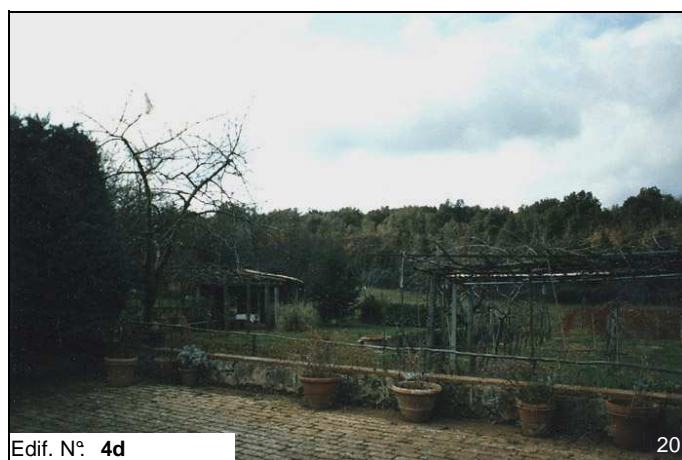
Edif. N° 4d