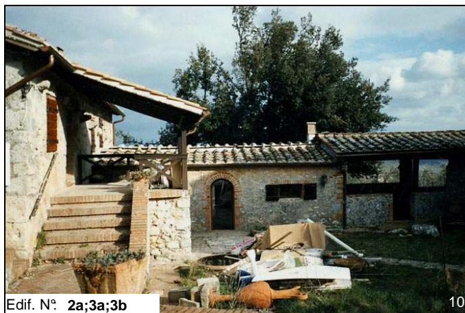
Edif. N° 2a;3a;3b