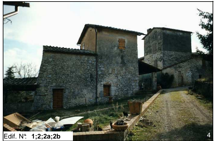
Edif. N° 1;2;2a;2b