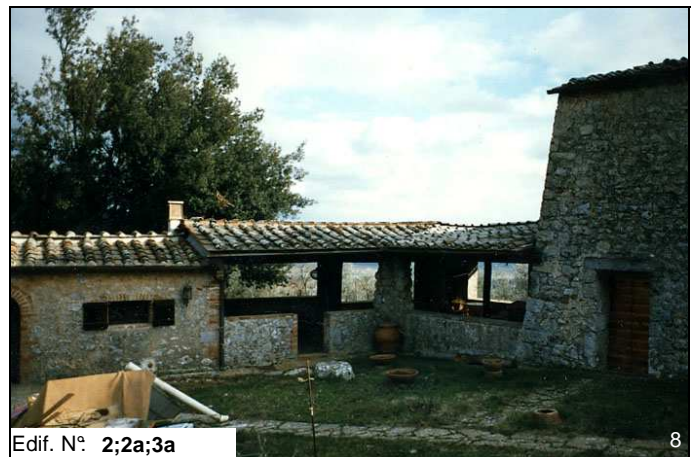
Edif. N° 2;2a;3a