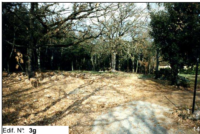
Edif. N° 3g