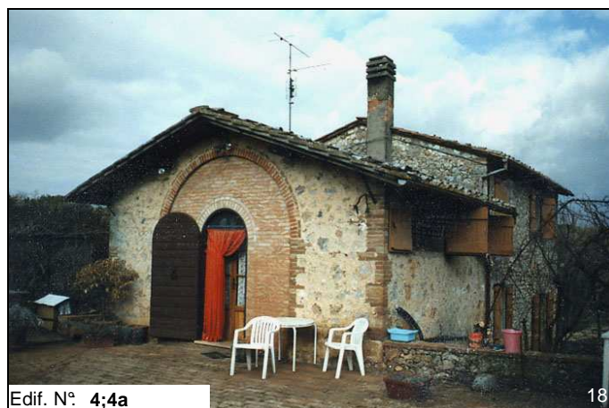
Edif. N° 4;4a