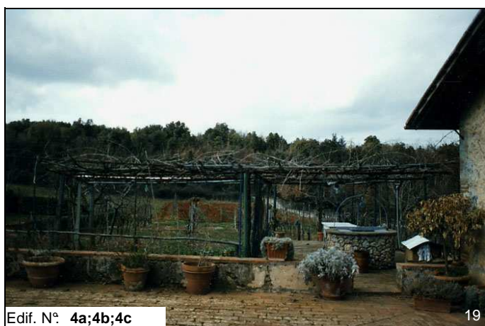
Edif. N° 4a;4b;4c