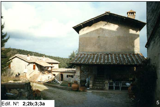
Edif. N° 2;2b;3;3a