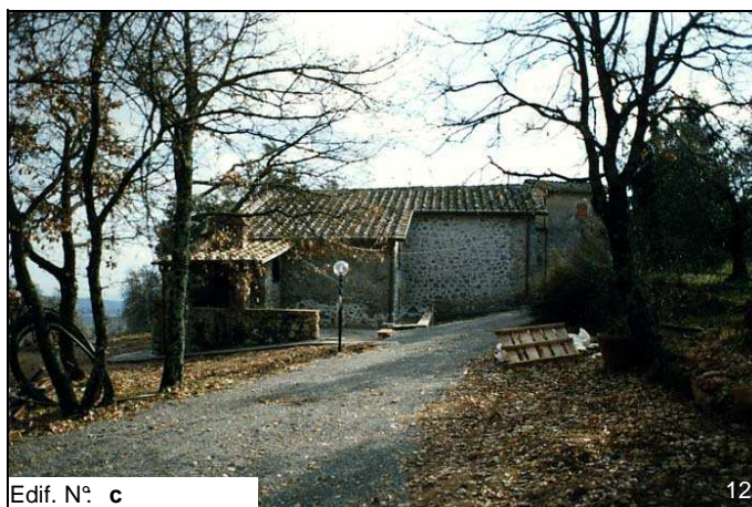
Edif. N° c