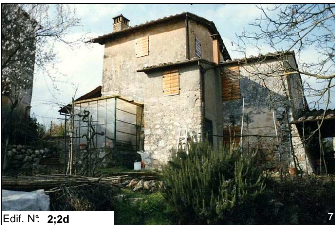
Edif. N° 2;2d