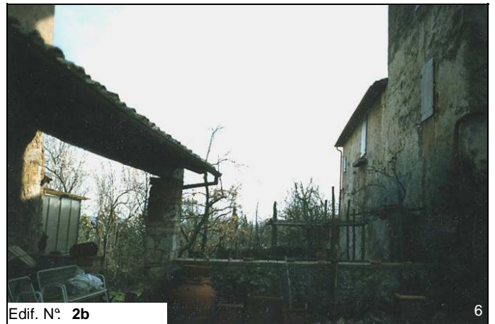
Edif. N° 2b