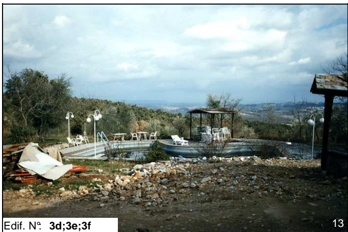
Edif. N° 3d;3e;3f