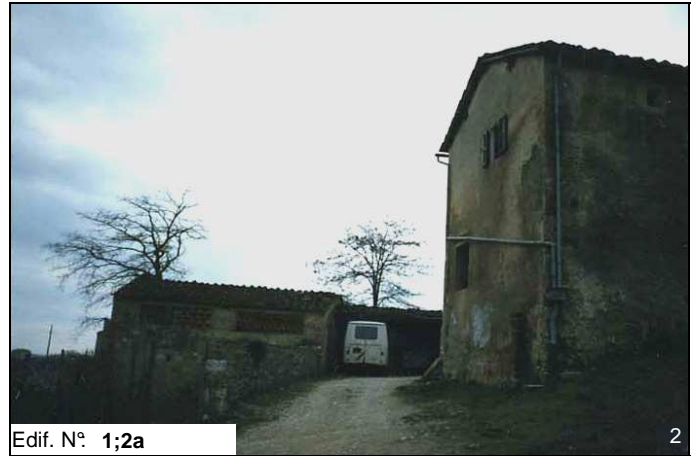
Edif. N° 1;2a