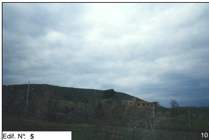
Edif. N° 5