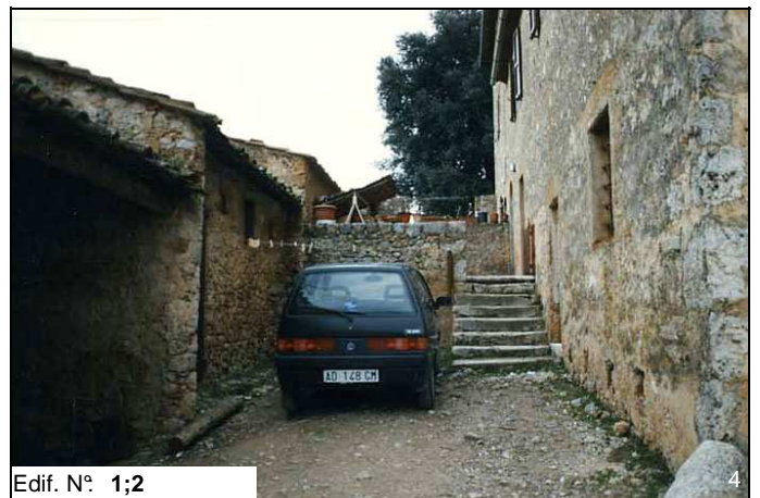
Edif. N° 1;2