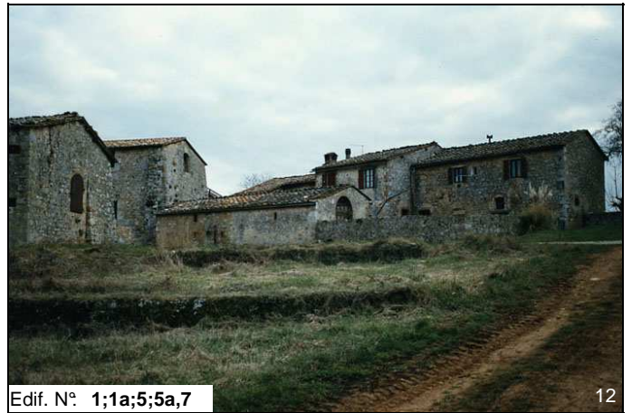
Edif. N° 1;1a;5;5a,7