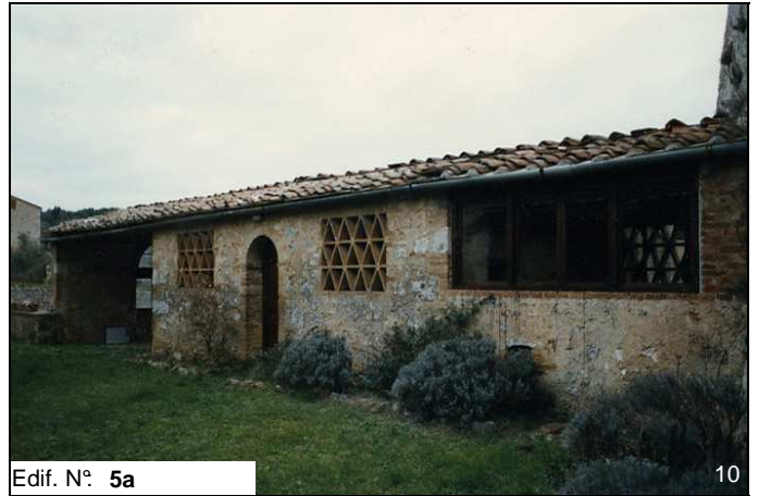
Edif. N° 5a