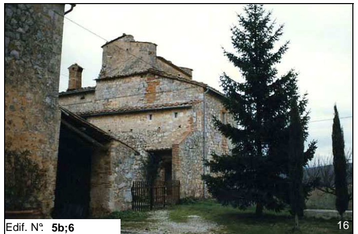
Edif. N° 5b;6