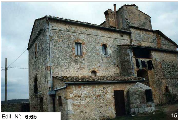
Edif. N° 6;6b