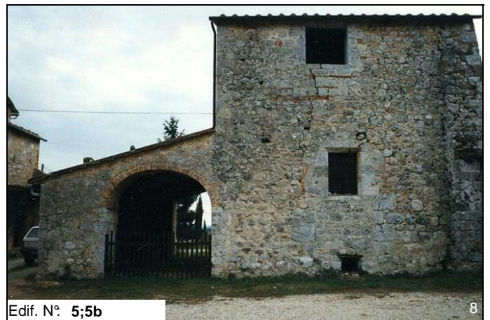
Edif. N° 5;5b