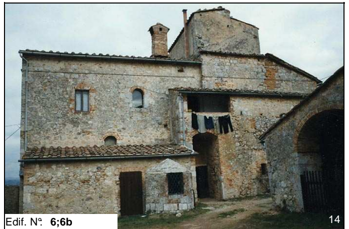
Edif. N° 6;6b