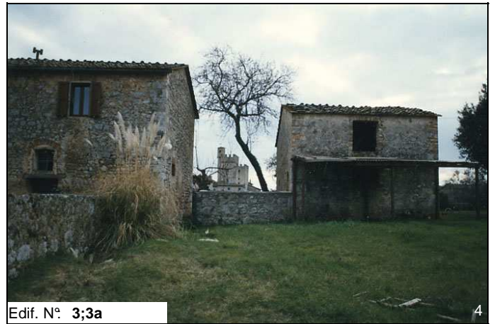
Edif. N° 3;3a