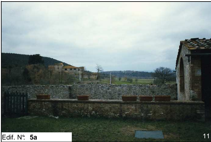
Edif. N° 5a