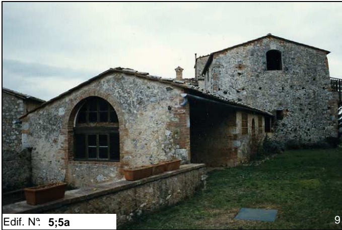
Edif. N° 5;5a