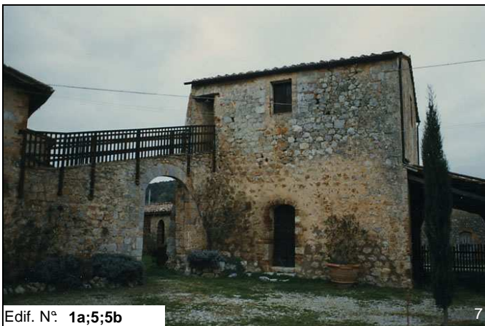
Edif. N° 1a;5;5b