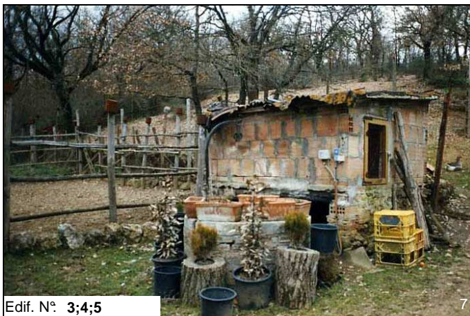
Edif. N° 3;4;5