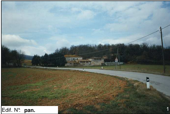
Edif. N° pan.