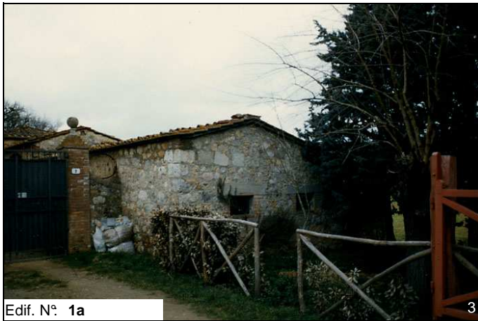
Edif. N° 1a