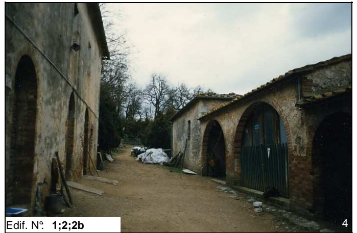
Edif. N° 1;2;2b