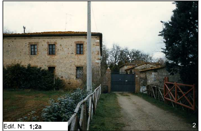
Edif. N° 1;2a