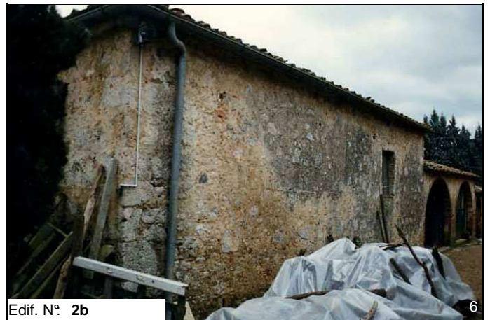
Edif. N° 2b