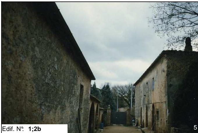
Edif. N° 1;2b