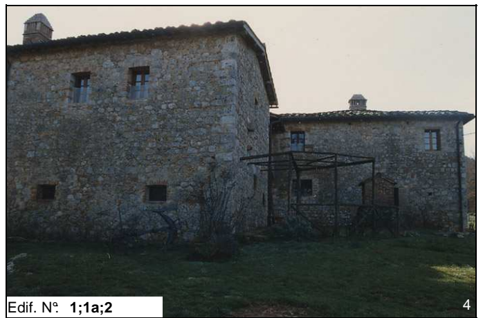
Edif. N° 1;1a;2