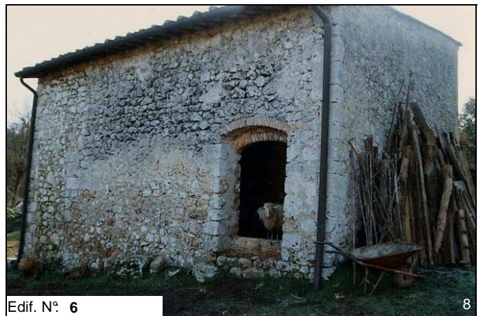
Edif. N° 6