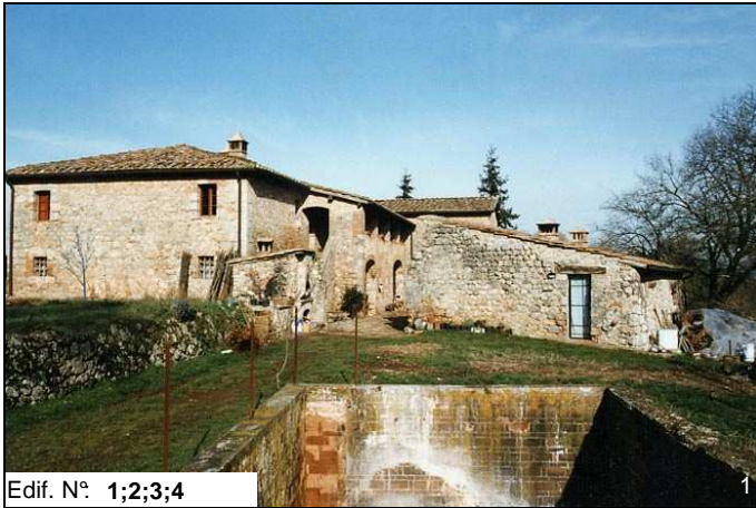
Edif. N° 1;2;3;4