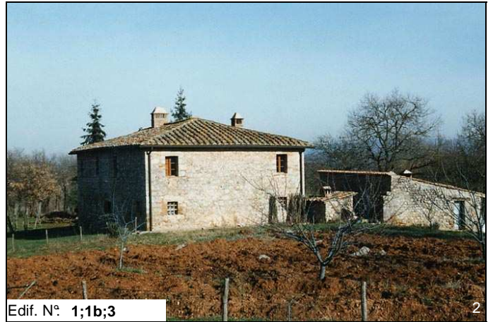
Edif. N° 1;1b;3