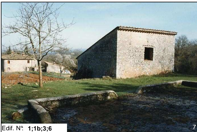
Edif. N° 1;1b;3;6