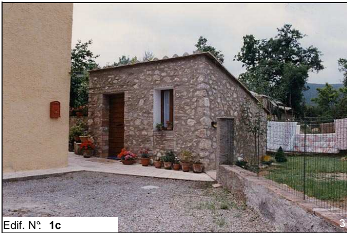
Edif. N° 1c