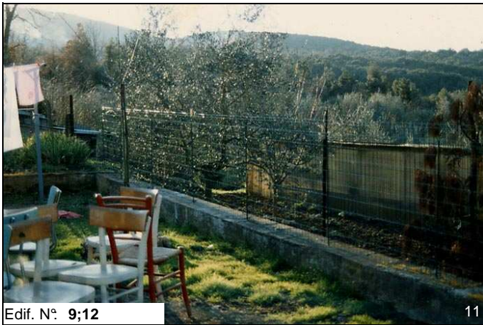
Edif. N° 9;12