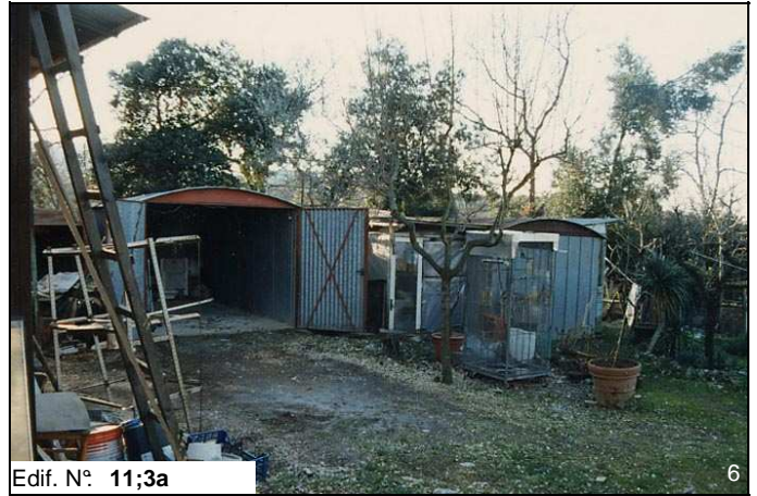
Edif. N° 11;3a