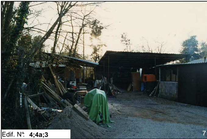
Edif. N° 4;4a;3