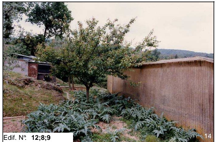
Edif. N° 12;8;9