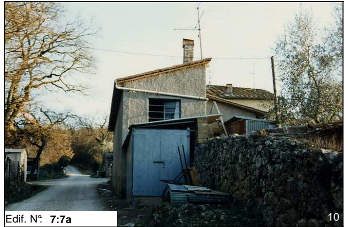
Edif. N° 7:7a