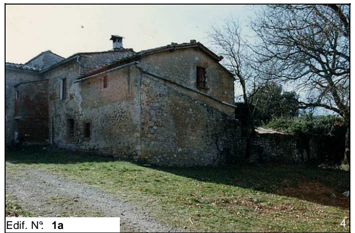
Edif. N° 1a