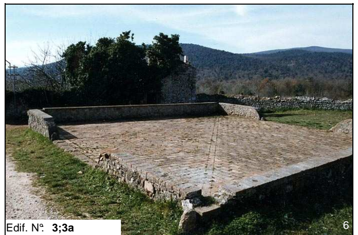
Edif. N° 3;3a