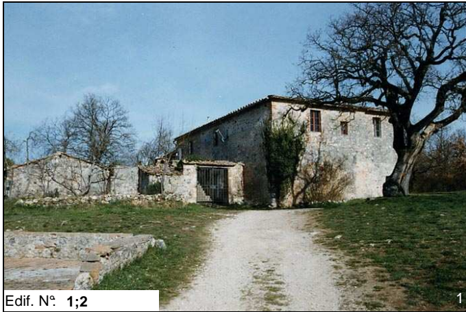
Edif. N° 1;2