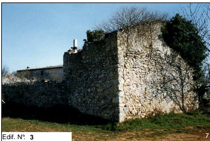
Edif. N° 3