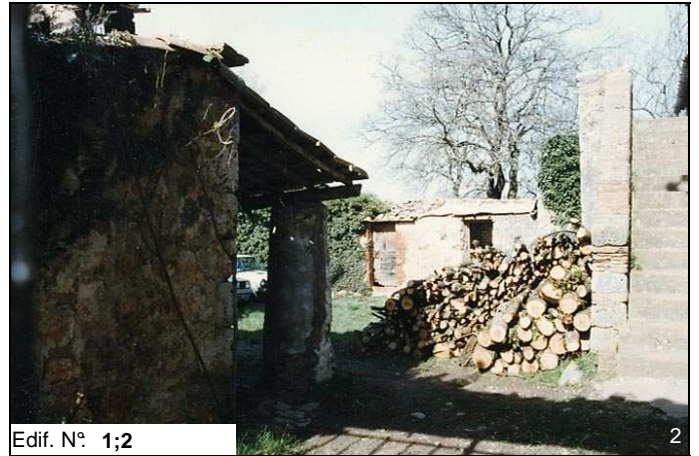
Edif. N° 1;2