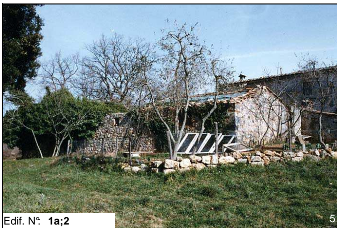
Edif. N° 1a;2