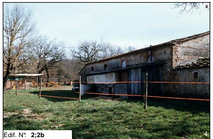
Edif. N° 2;2b