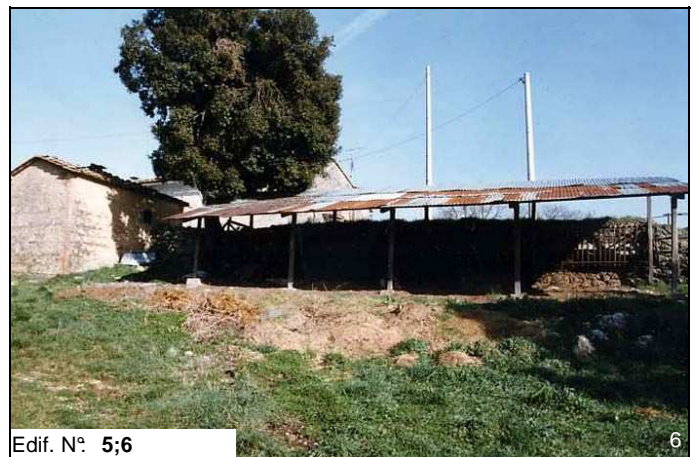
Edif. N° 5;6