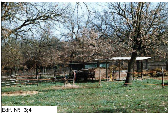
Edif. N° 3;4