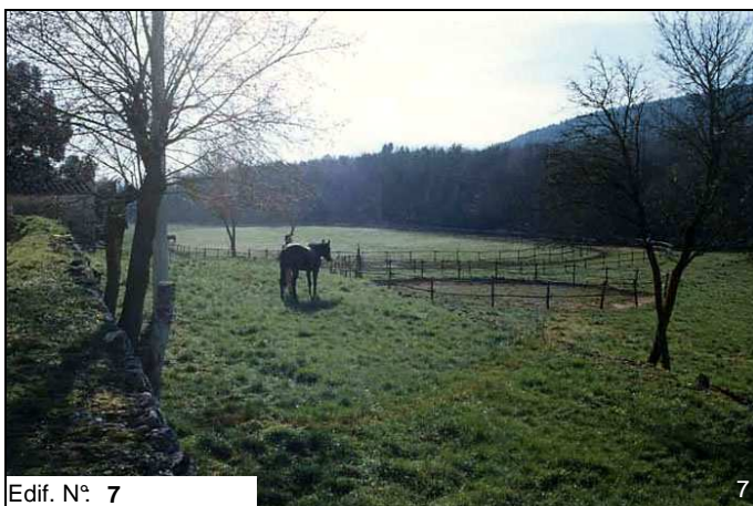
Edif. N° 7