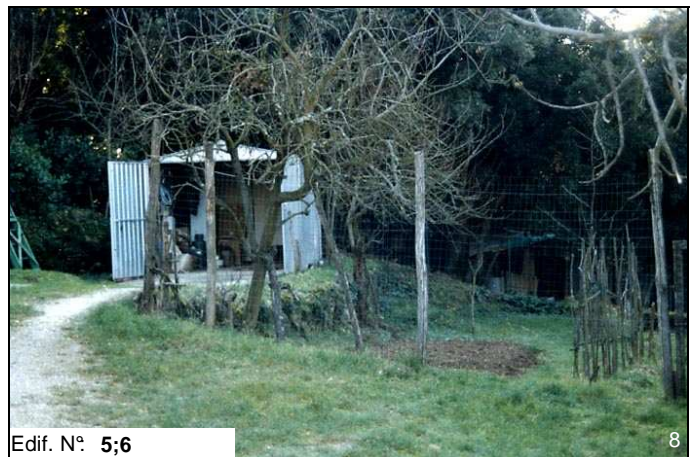
Edif. N° 5;6