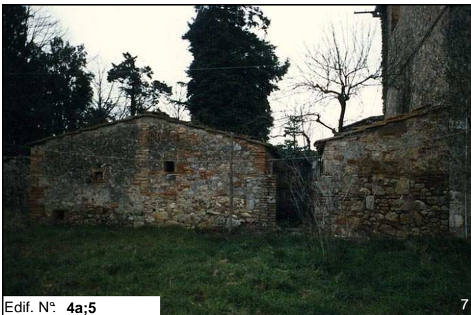
Edif. N° 4a;5