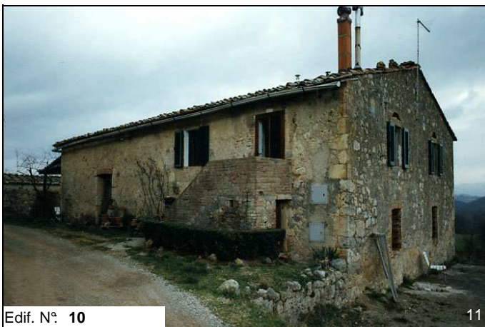
Edif. N° 10