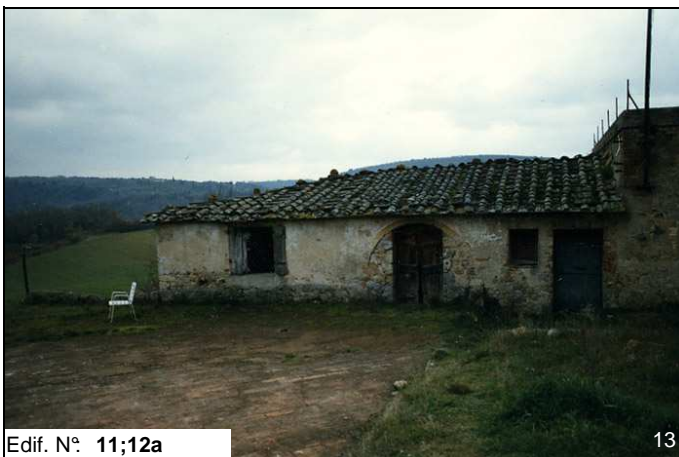
Edif. N° 11;12a