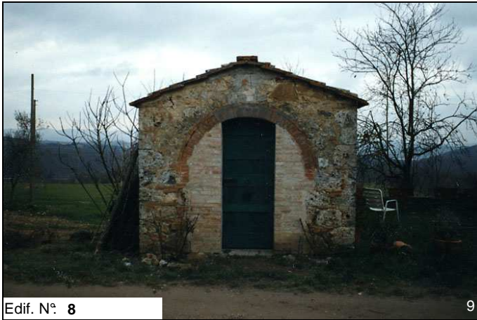
Edif. N° 8