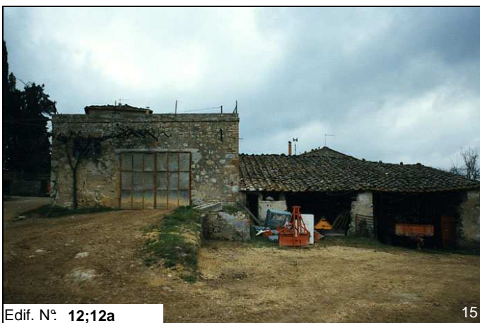
Edif. N° 12;12a