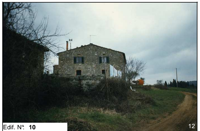
Edif. N° 10