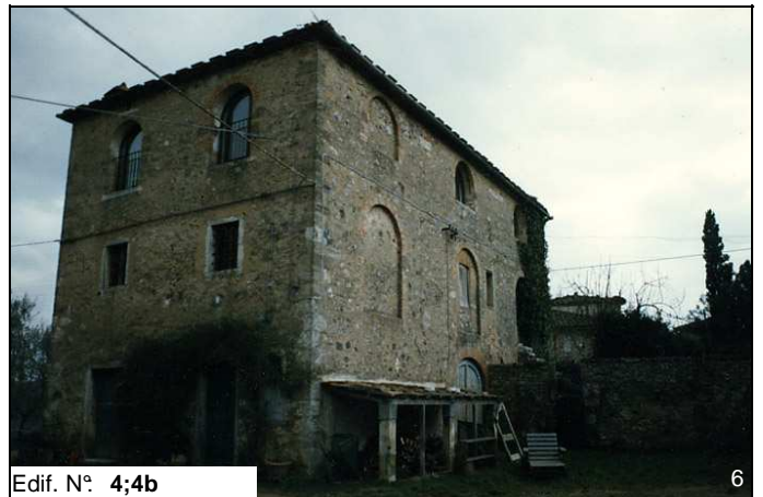
Edif. N° 4;4b