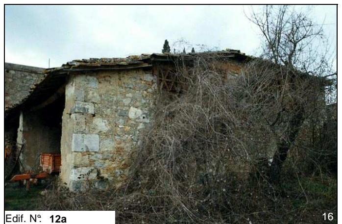
Edif. N° 12a