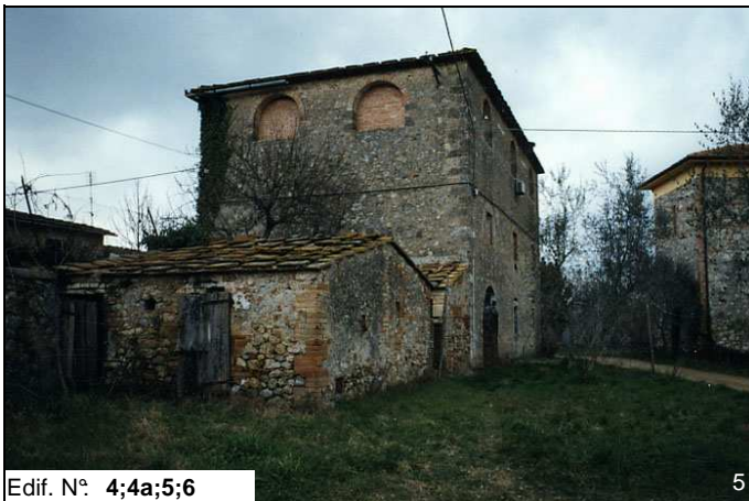
Edif. N° 4;4a;5;6