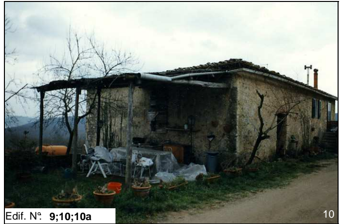
Edif. N° 9;10;10a