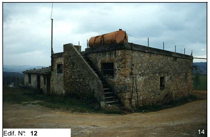
Edif. N° 12