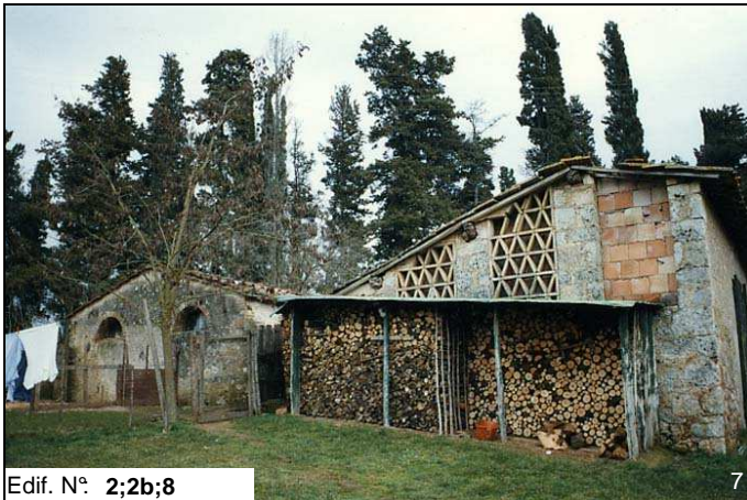
Edif. N° 2;2b;8