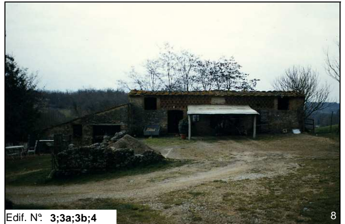
Edif. N° 3;3a;3b;4