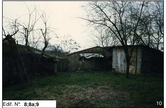
Edif. N° 8;8a;9