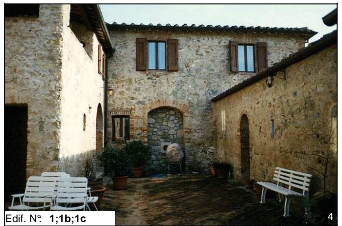
Edif. N° 1;1b;1c