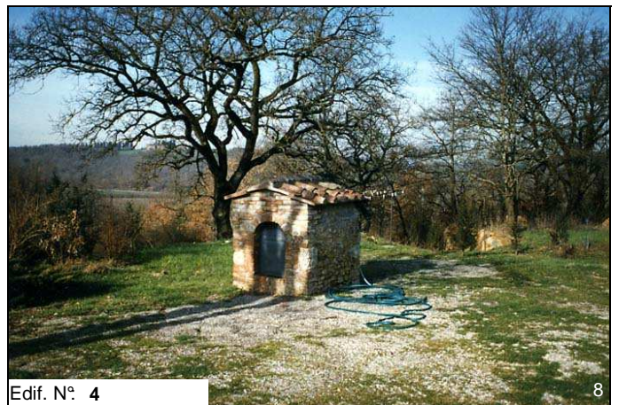
Edif. N° 4