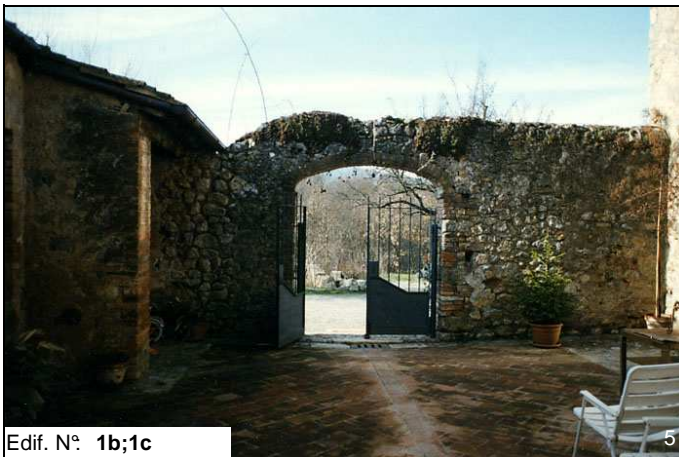
Edif. N° 1b;1c