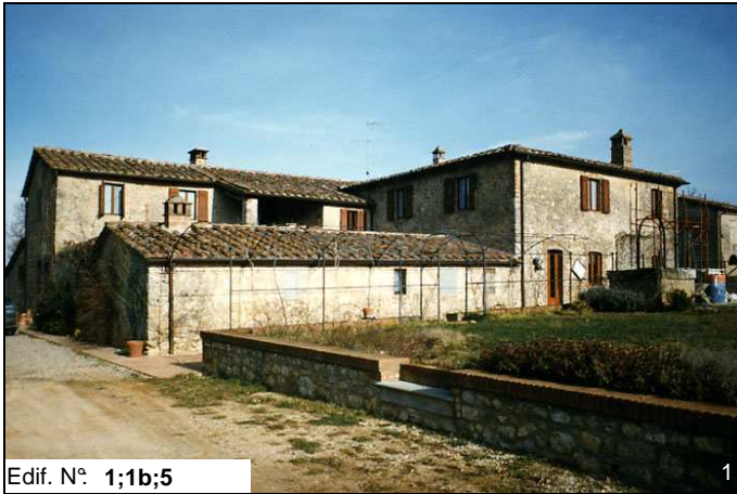
Edif. N° 1;1b;5