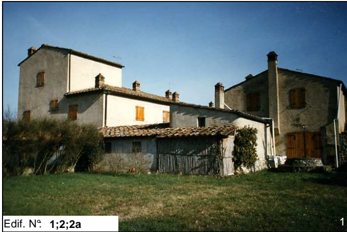
Edif. N° 1;2;2a