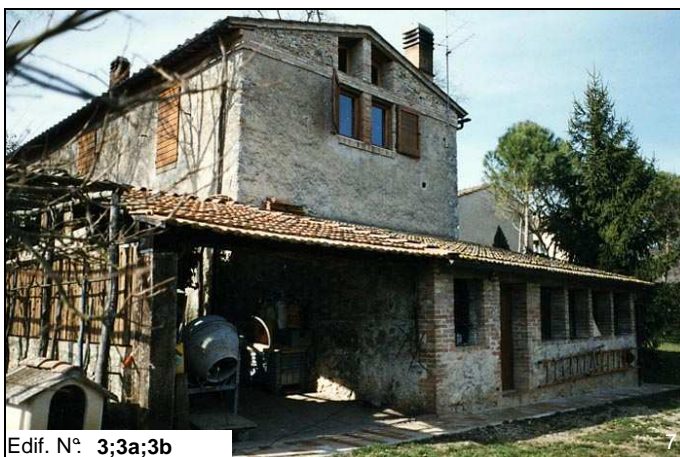
Edif. N° 3;3a;3b