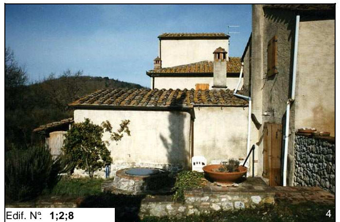
Edif. N° 1;2;8