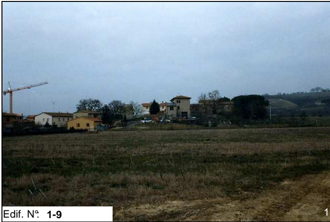
Edif. N° 1-9