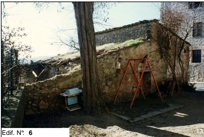
Edif. N° 6