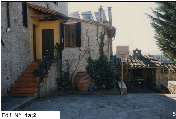
Edif. N° 1a;2