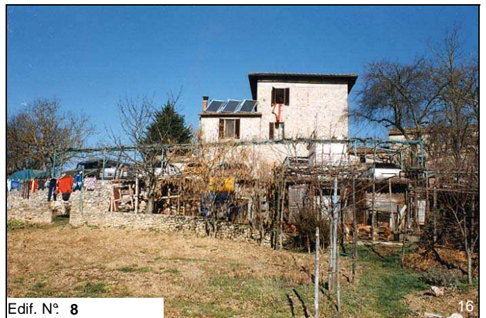
Edif. N° 8