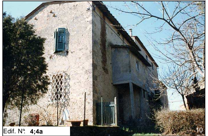
Edif. N° 4;4a