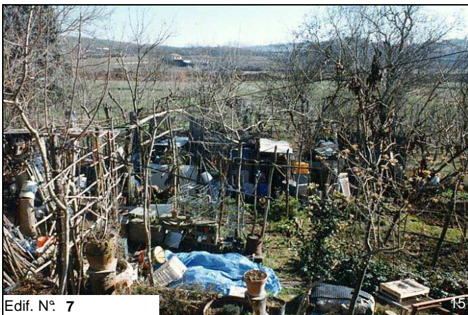
Edif. N° 7