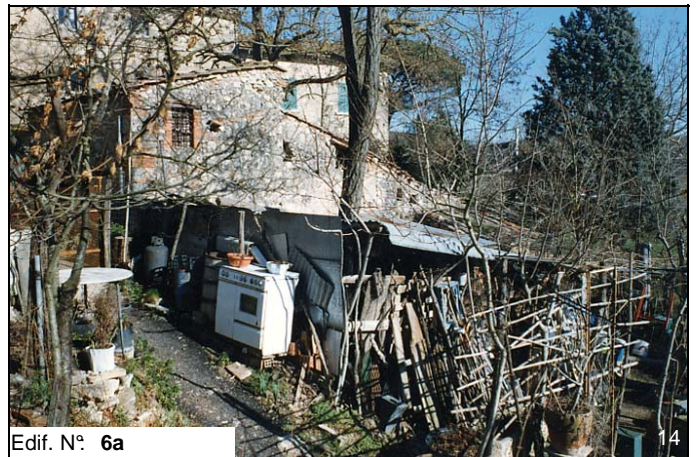
Edif. N° 6a