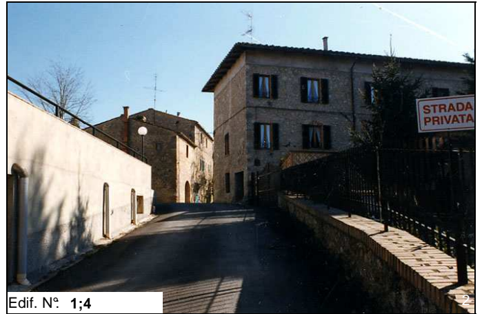
Edif. N° 1;4