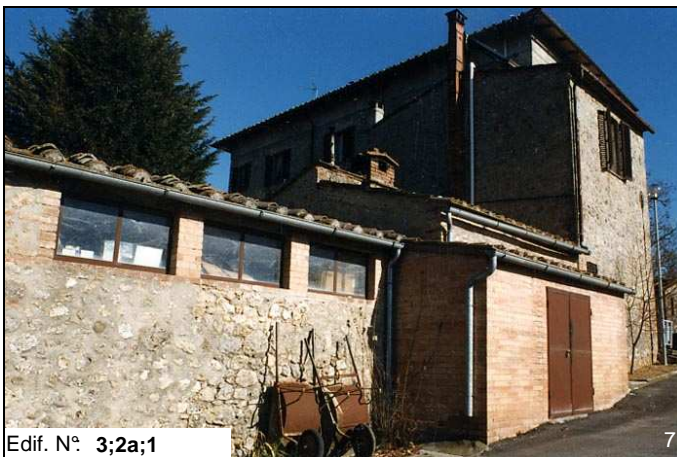
Edif. N° 3;2a;1