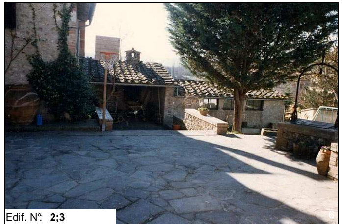
Edif. N° 2;3