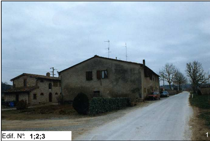
Edif. N° 1;2;3