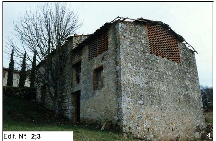
Edif. N° 2;3