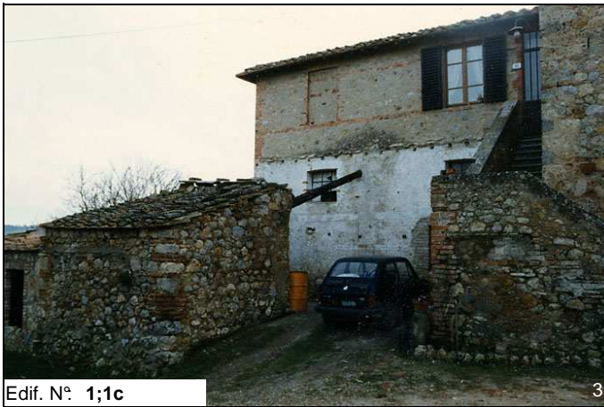
Edif. N° 1;1c