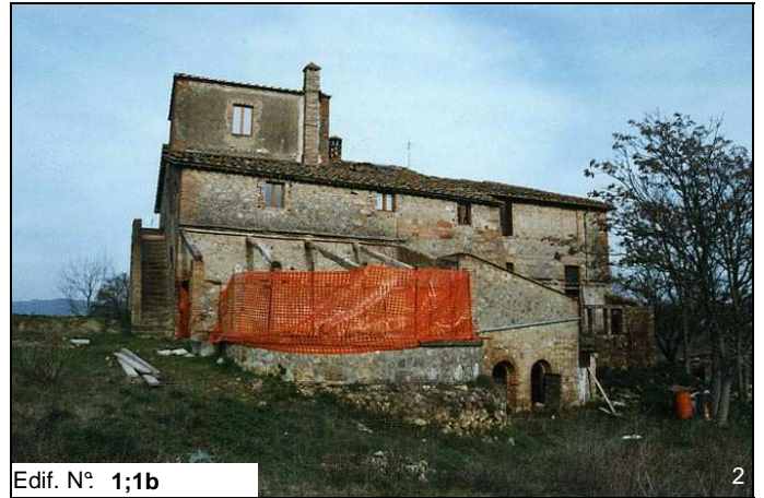
Edif. N° 1;1b