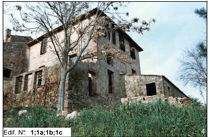
Edif. N° 1;1a;1b;1c