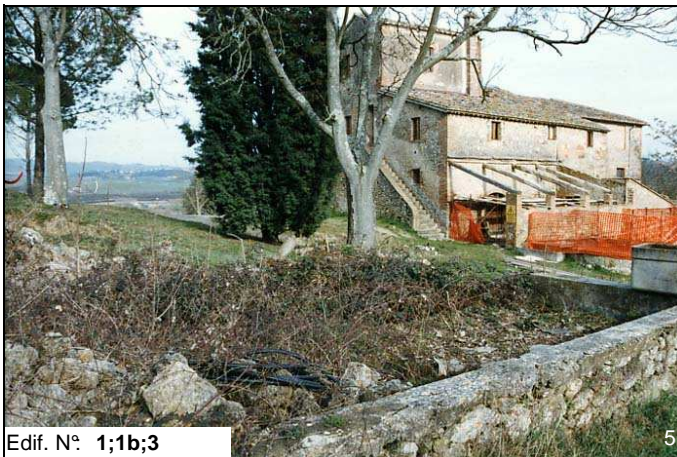
Edif. N° 1;1b;3