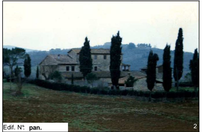
Edif. N° pan.