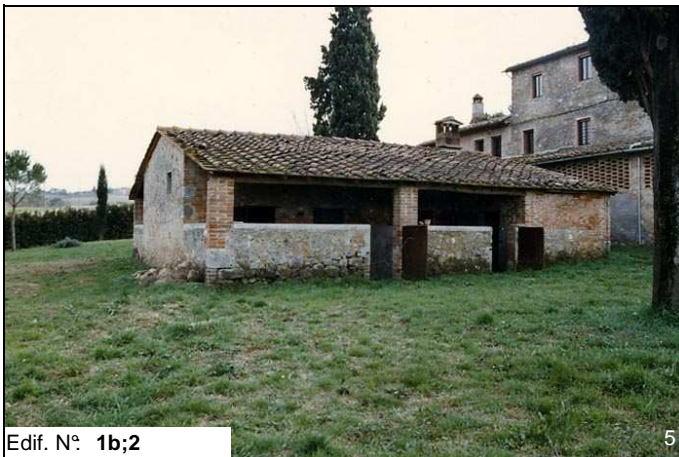
Edif. N° 1b;2