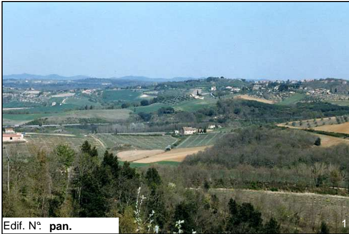
Edif. N° pan.