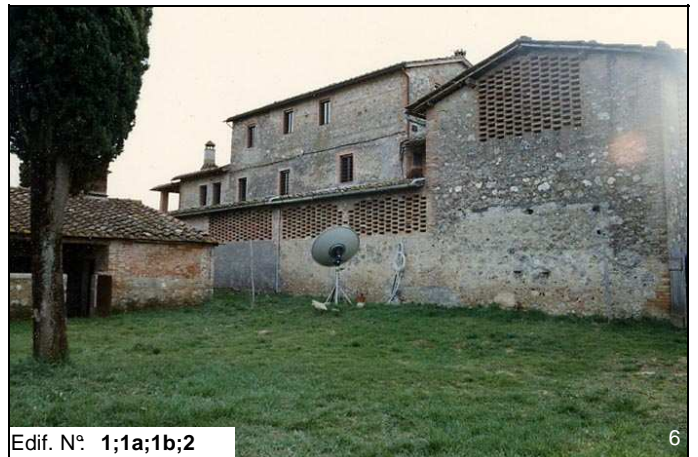
Edif. N° 1;1a;1b;2