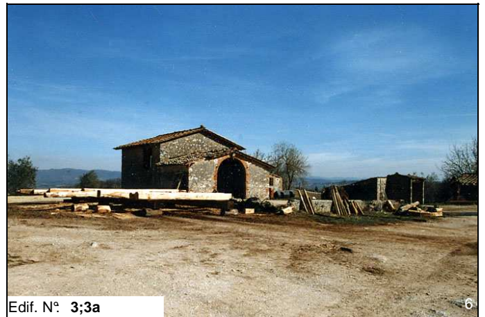
Edif. N° 3;3a