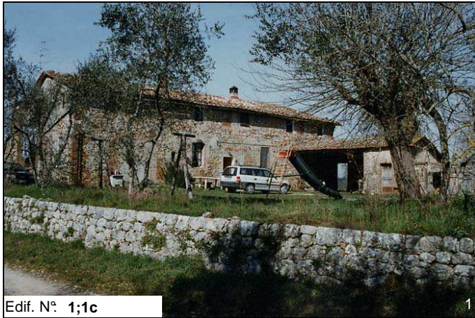
Edif. N° 1;1c