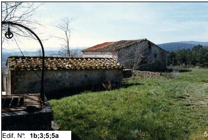
Edif. N° 1b;3;5;5a