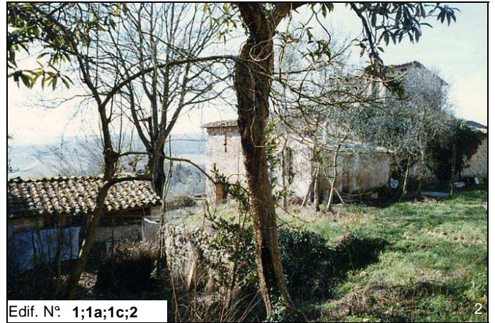
Edif. N° 1;1a;1c;2