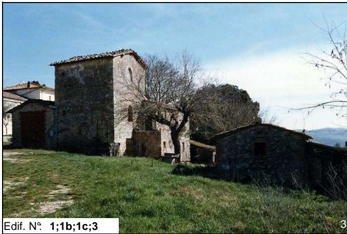
Edif. N° 1;1b;1c;3