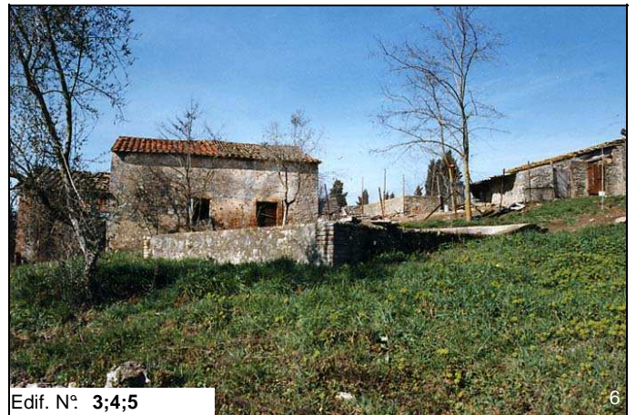
Edif. N° 3;4;5