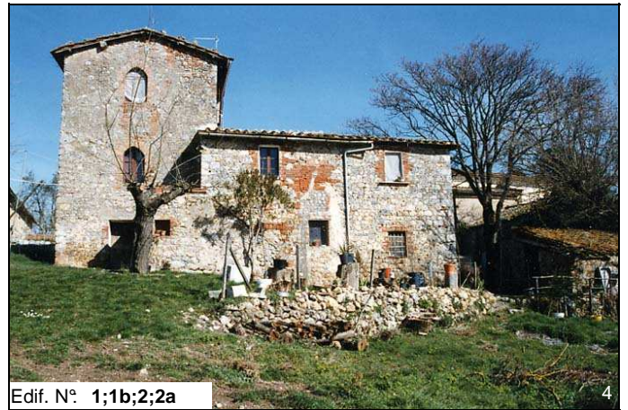
Edif. N° 1;1b;2;2a