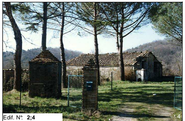
Edif. N° 2;4