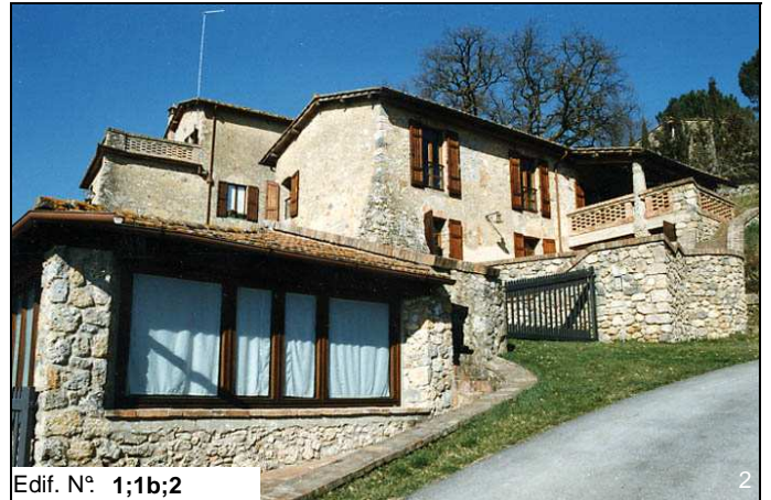
Edif. N° 1;1b;2