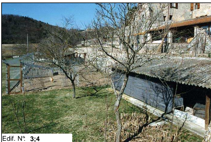
Edif. N° 3;4