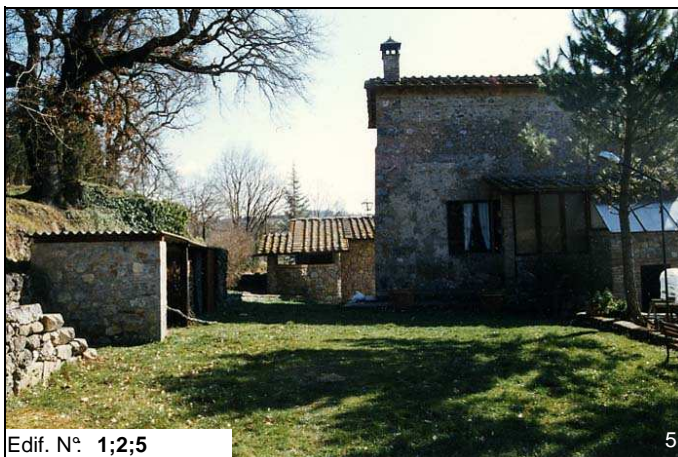
Edif. N° 1;2;5