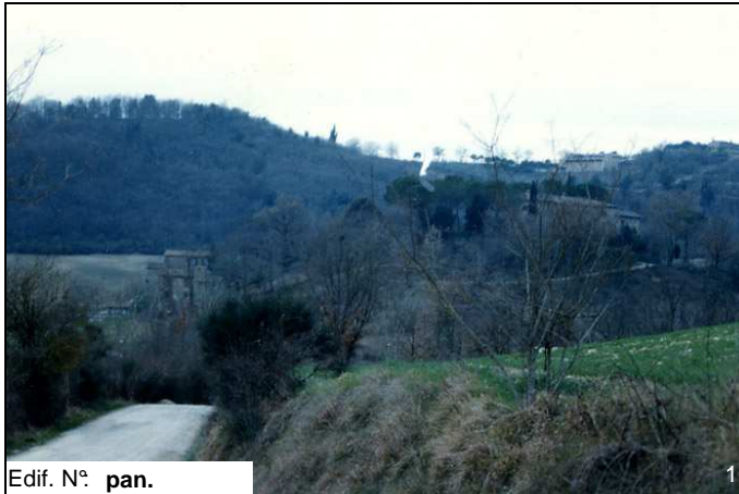
Edif. N° pan.