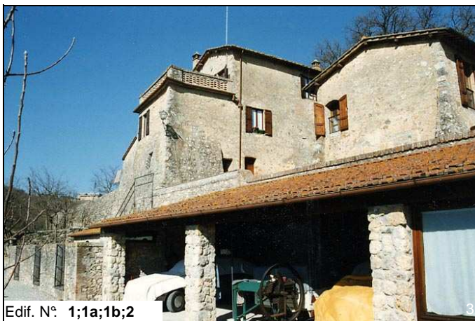
Edif. N° 1;1a;1b;2