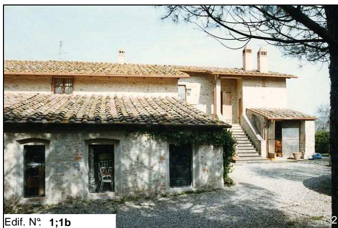
Edif. N° 1;1b