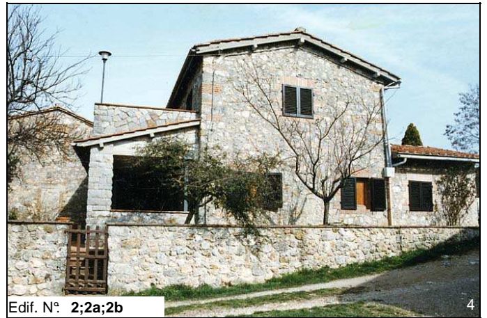
Edif. N° 2;2a;2b