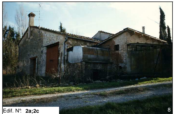
Edif. N° 2a;2c