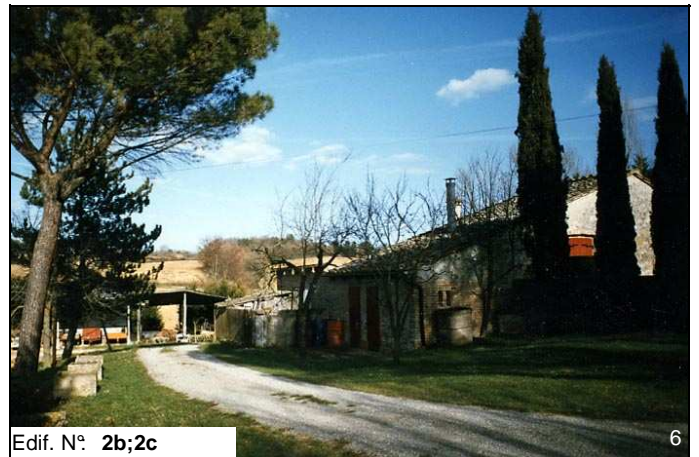
Edif. N° 2b;2c