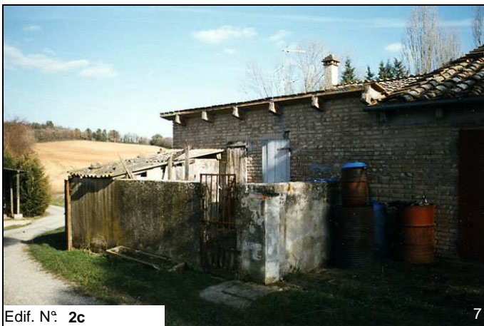
Edif. N° 2c