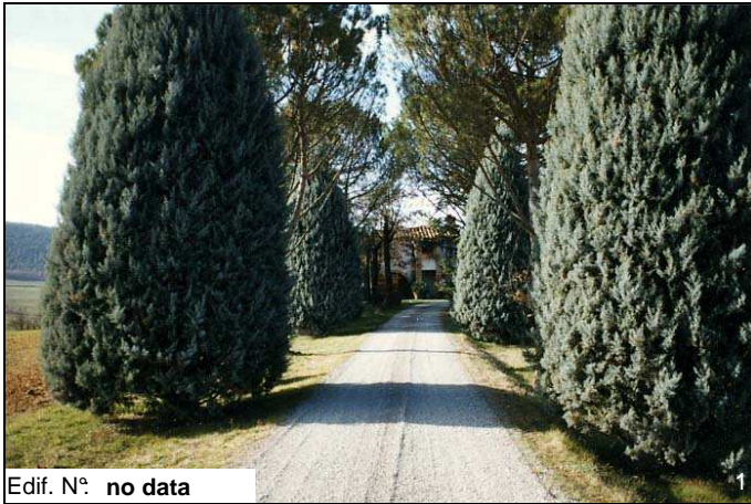
Edif. N° no data