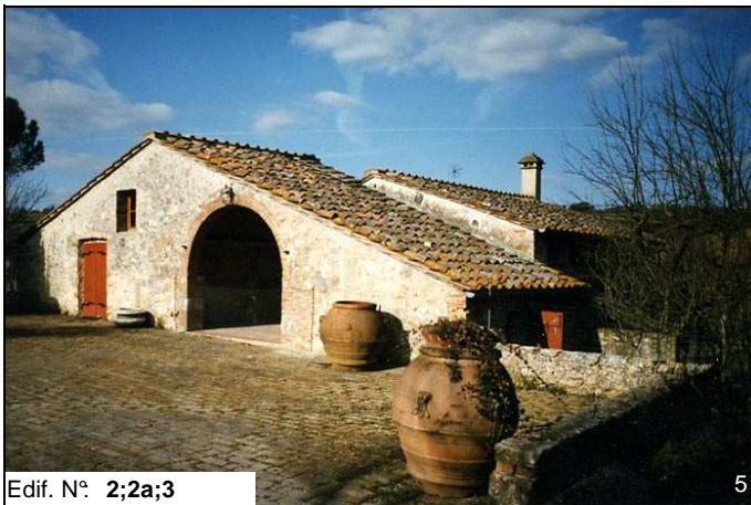
Edif. N° 2;2a;3