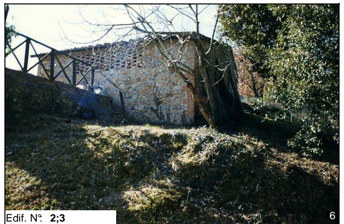
Edif. N° 2;3