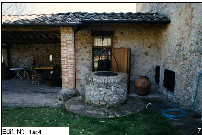
Edif. N° 1a;4