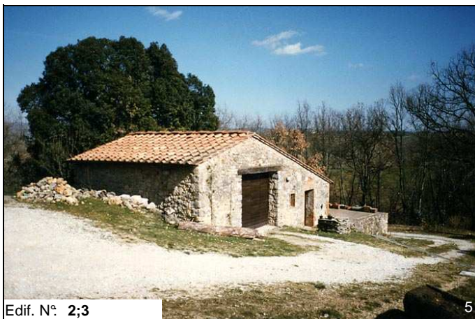
Edif. N° 2;3