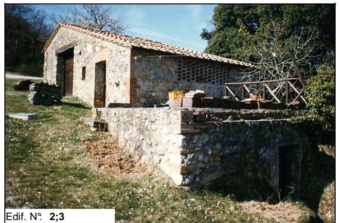
Edif. N° 2;3