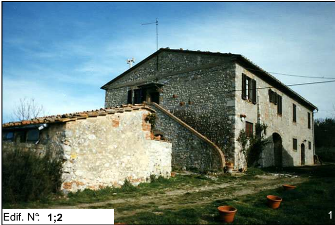
Edif. N° 1;2