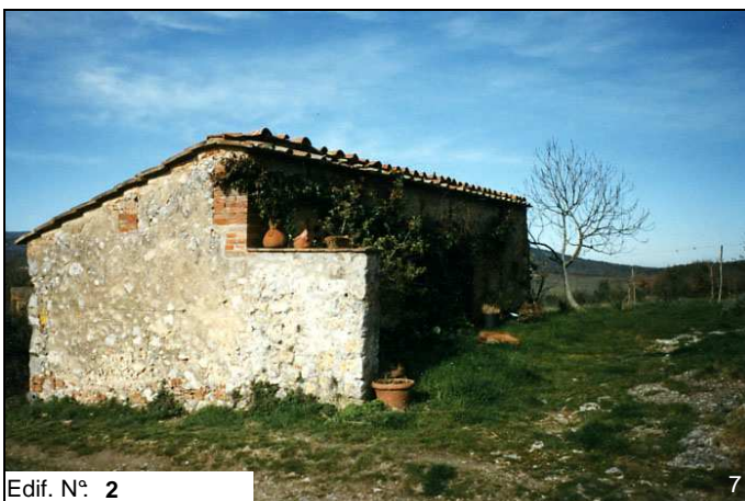
Edif. N° 2