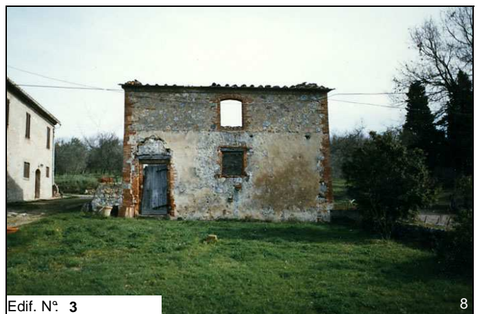
Edif. N° 3