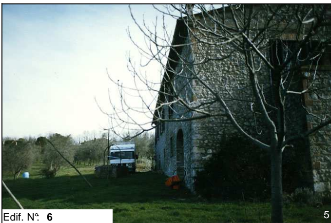
Edif. N° 6