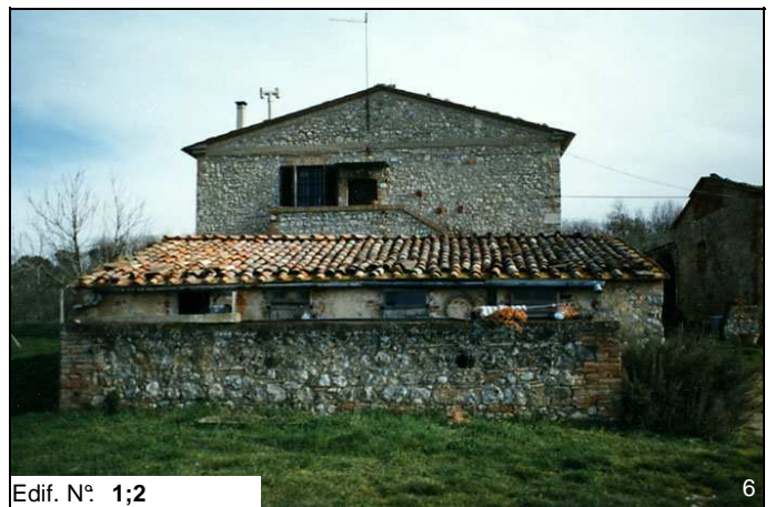
Edif. N° 1;2