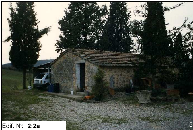
Edif. N° 2;2a