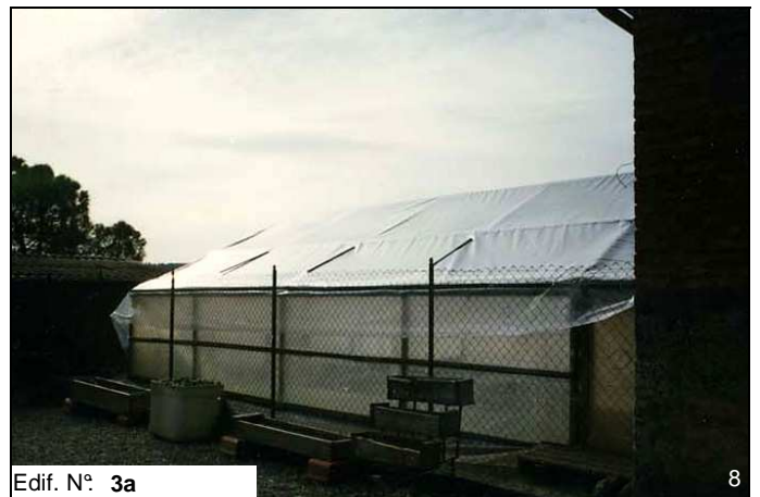
Edif. N° 3a