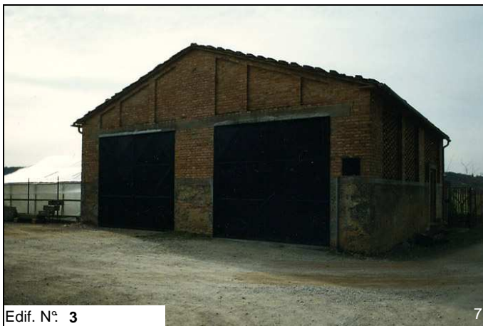
Edif. N° 3