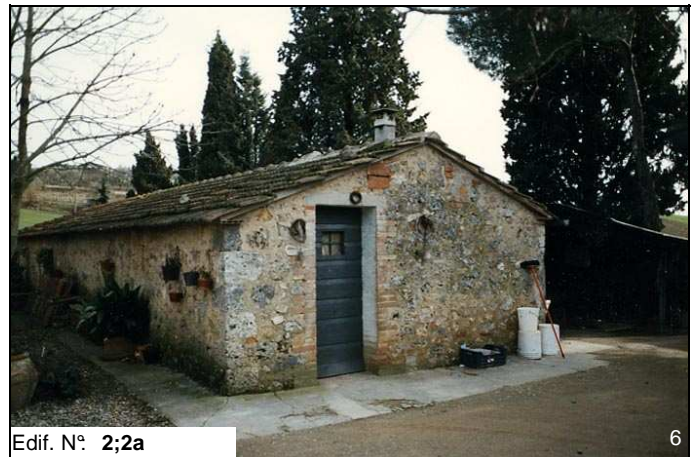
Edif. N° 2;2a