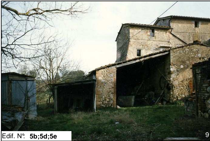
Edif. N° 5b;5d;5e