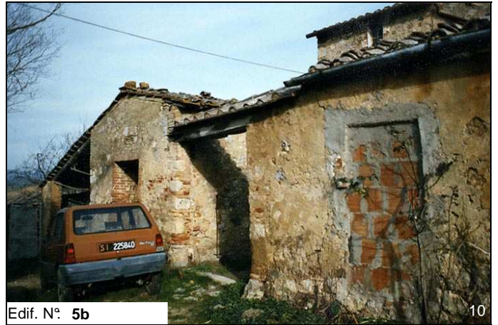
Edif. N° 5b