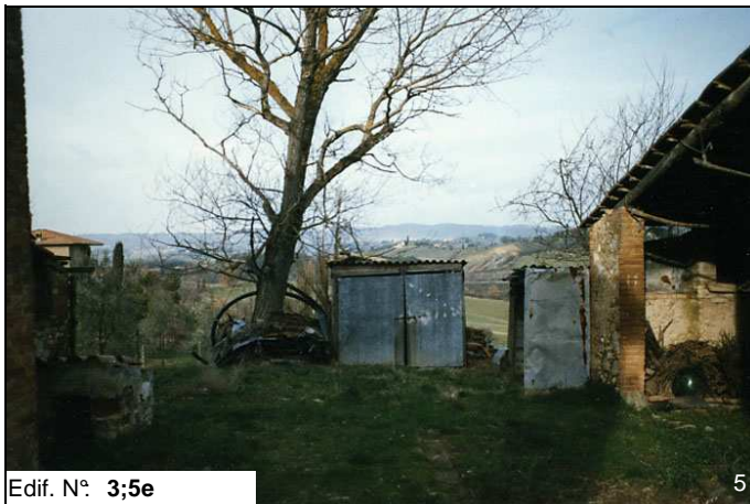
Edif. N° 3;5e