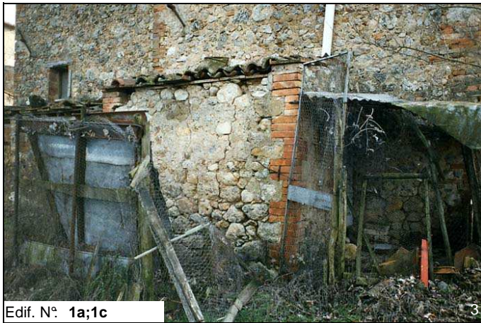
Edif. N° 1a;1c