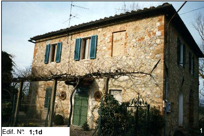
Edif. N° 1;1d