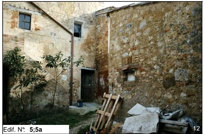
Edif. N° 5;5a