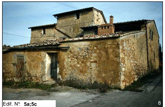
Edif. N° 5a;5c