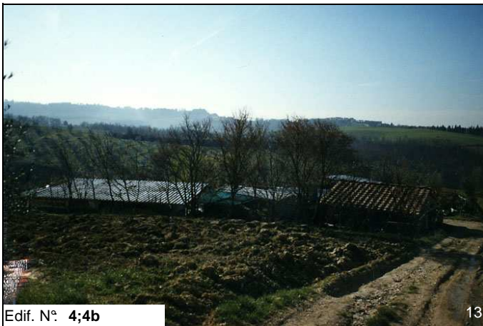
Edif. N° 4;4b