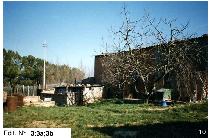
Edif. N° 3;3a;3b