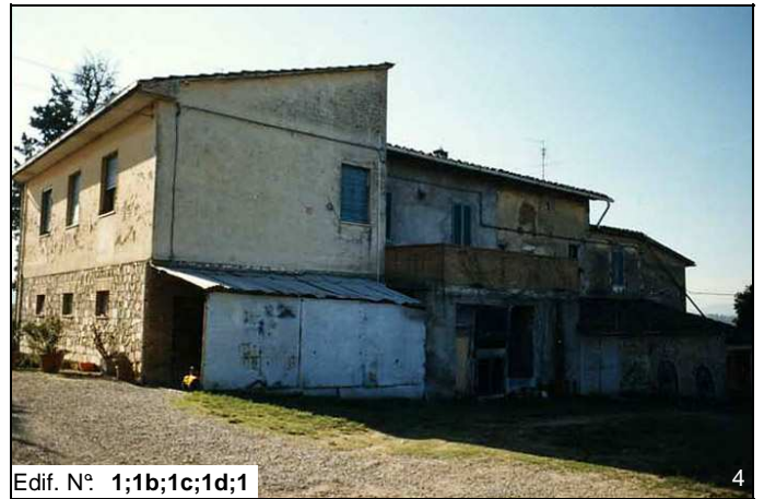
Edif. N° 1;1b;1c;1d;1