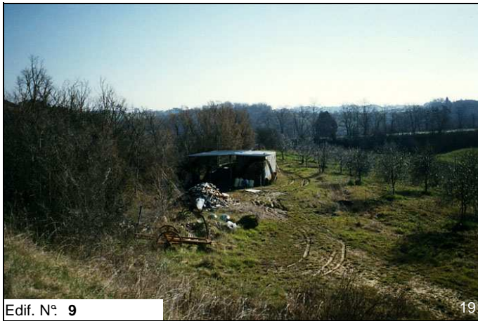
Edif. N° 9