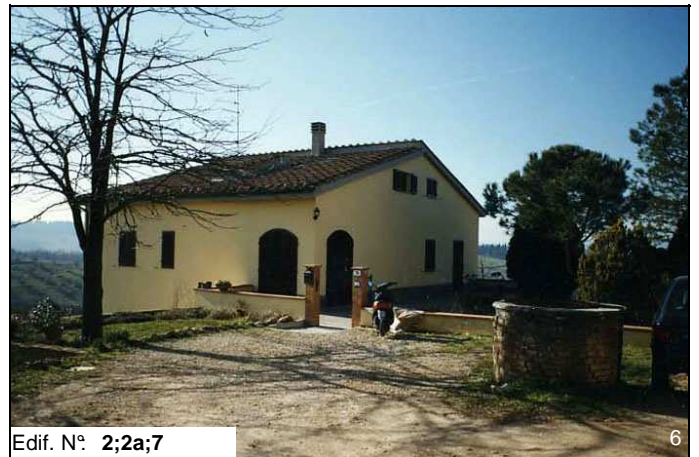
Edif. N° 2;2a;7