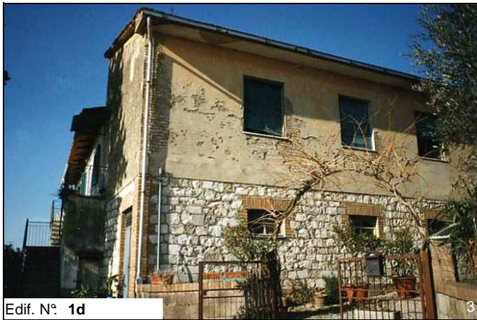
Edif. N° 1d