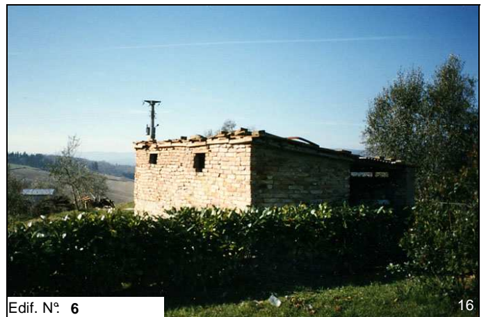
Edif. N° 6