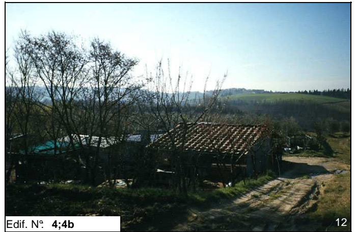
Edif. N° 4;4b