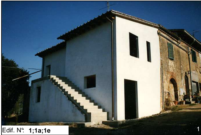
Edif. N° 1;1a;1e