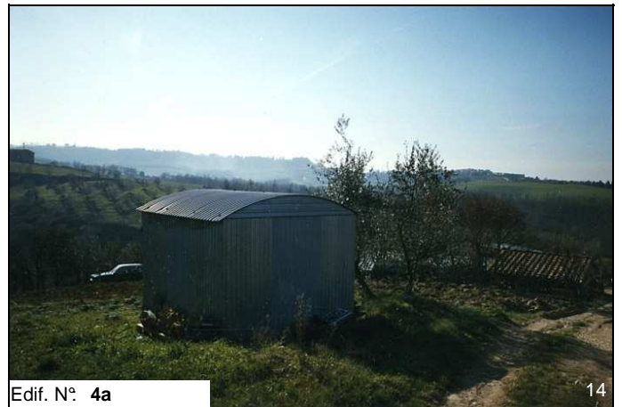
Edif. N° 4a