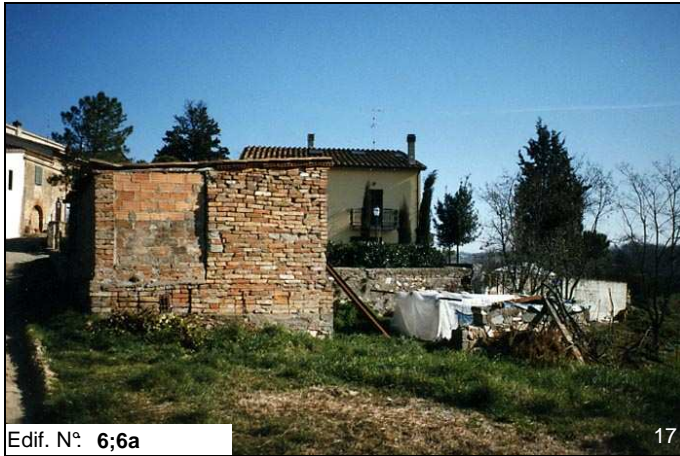
Edif. N° 6;6a