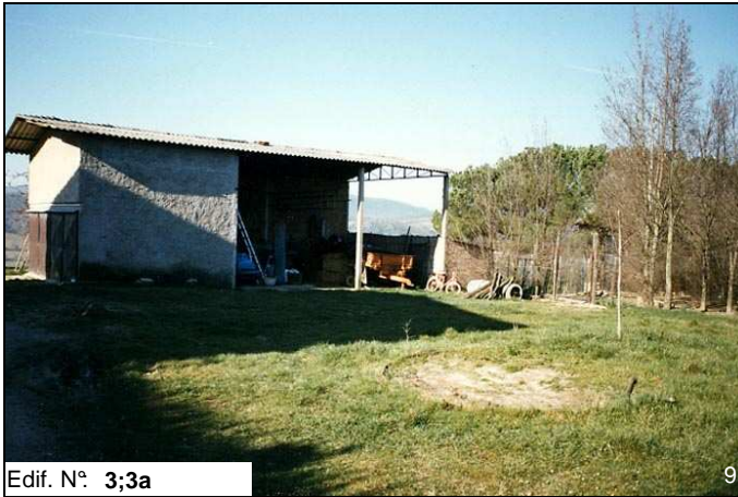
Edif. N° 3;3a