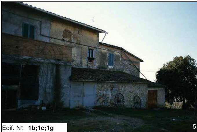
Edif. N° 1b;1c;1g