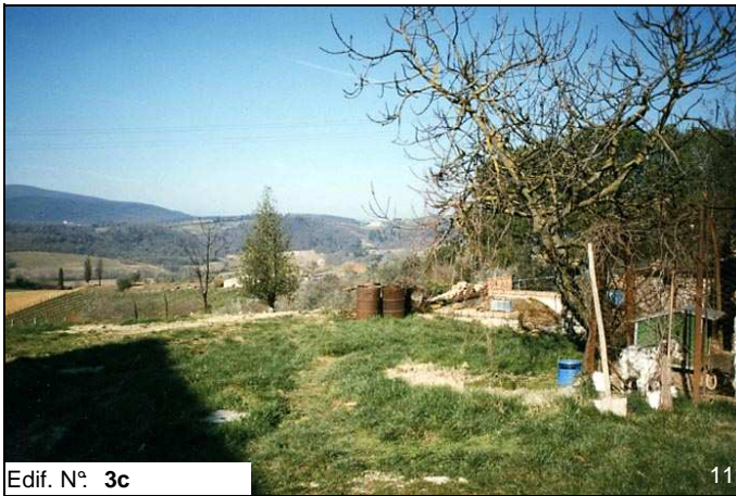
Edif. N° 3c