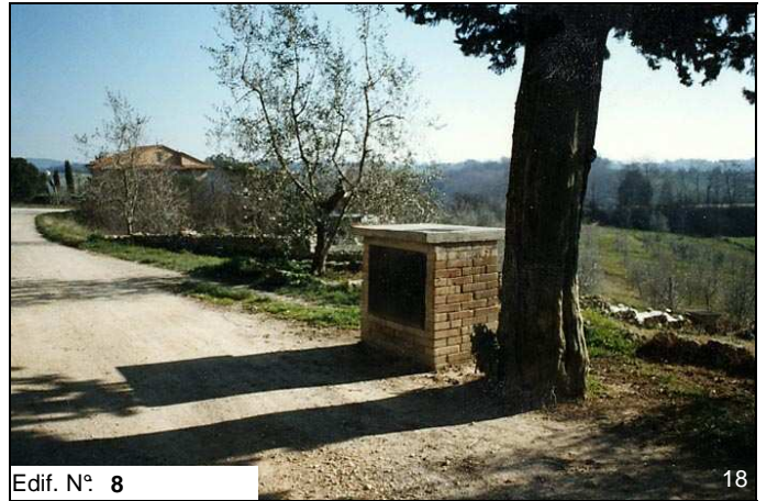
Edif. N° 8