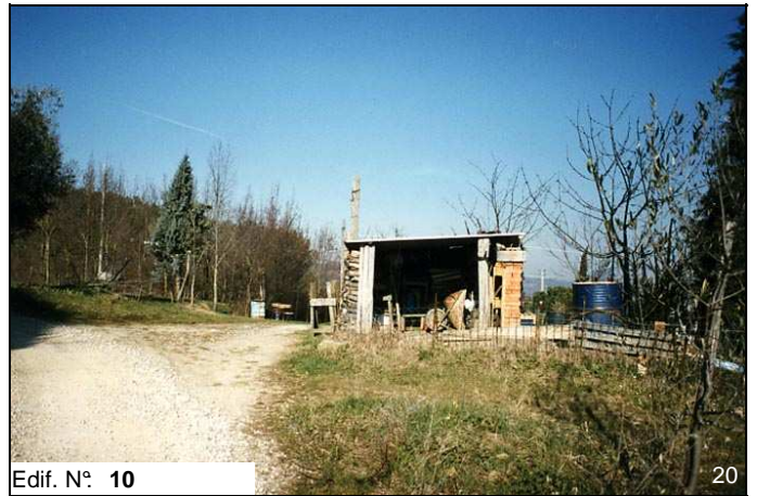
Edif. N° 10