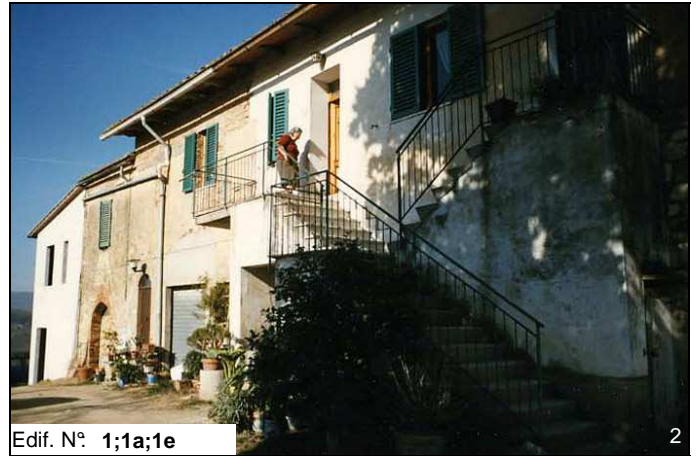
Edif. N° 1;1a;1e