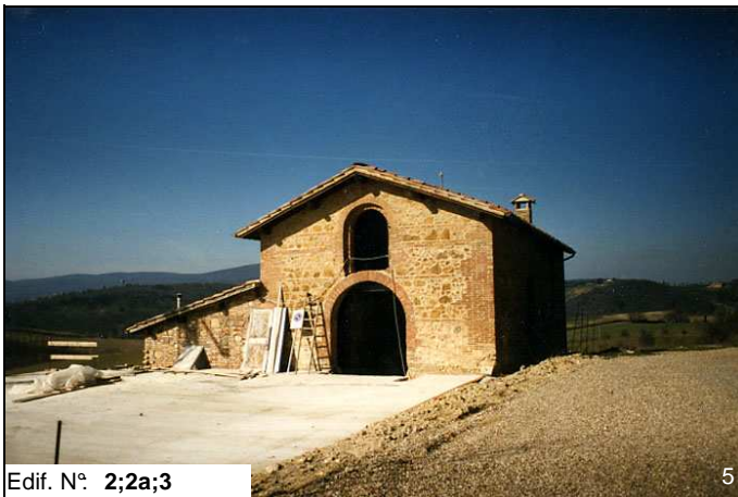
Edif. N° 2;2a;3