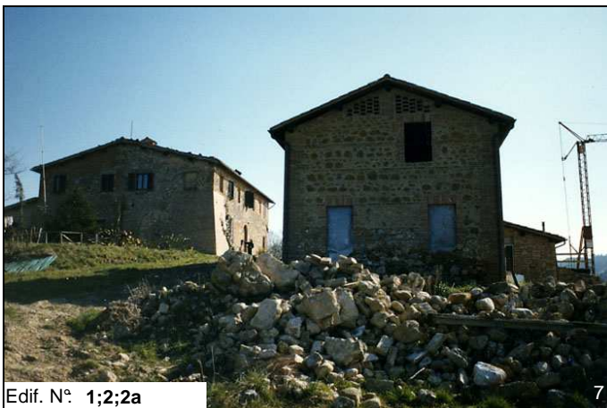
Edif. N° 1;2;2a