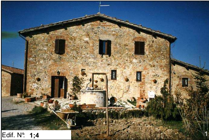
Edif. N° 1;4