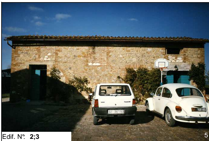
Edif. N° 2;3