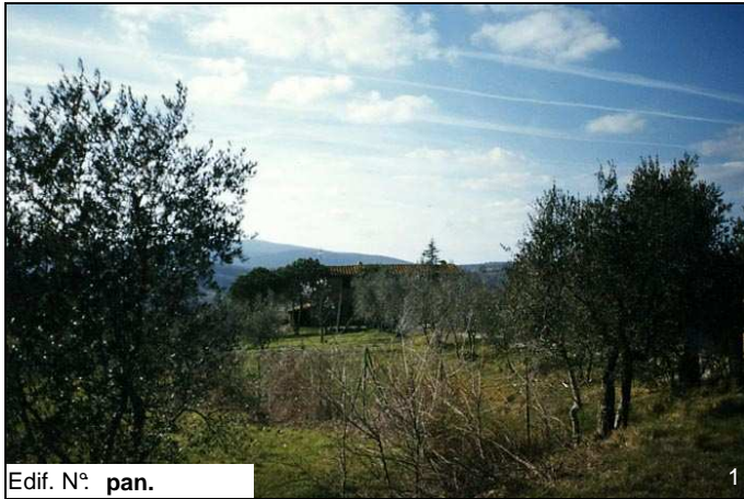
Edif. N° pan.