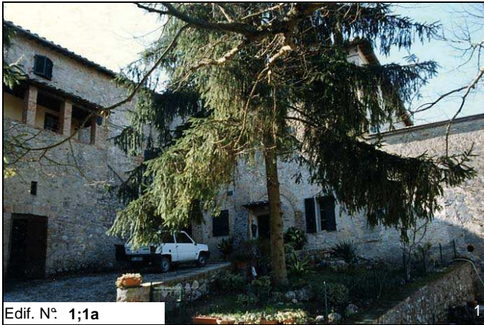
Edif. N° 1;1a