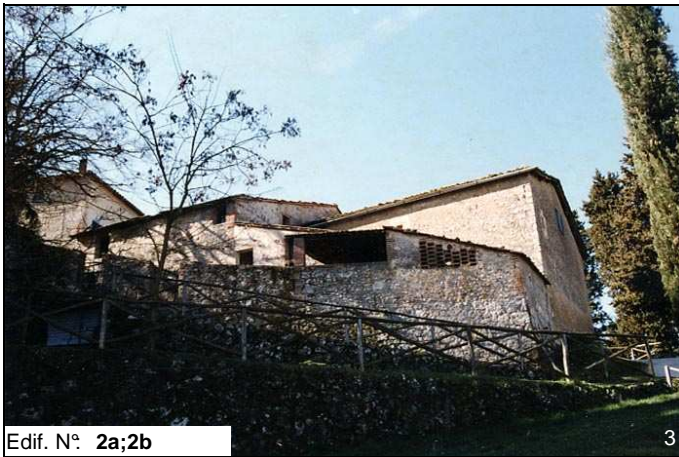
Edif. N° 2a;2b