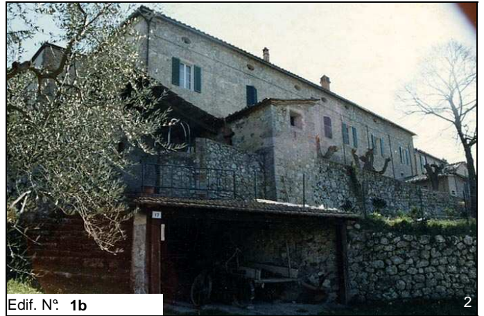
Edif. N° 1b