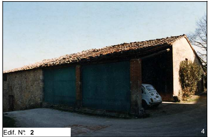
Edif. N° 2