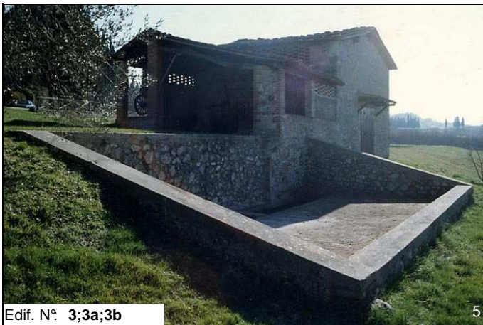
Edif. N° 3;3a;3b