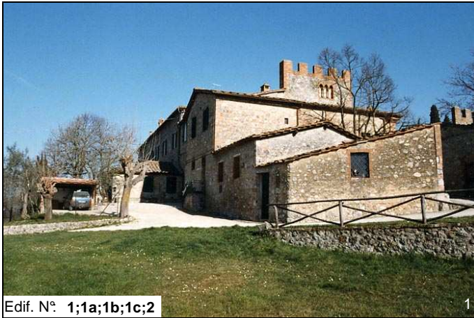
Edif. N° 1;1a;1b;1c;2