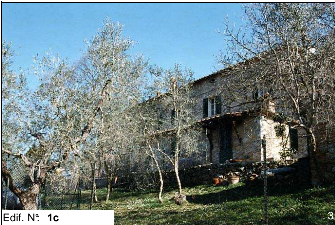
Edif. N° 1c