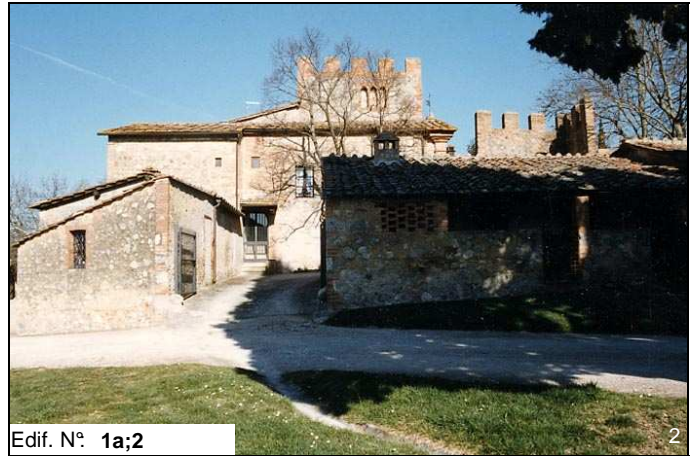
Edif. N° 1a;2