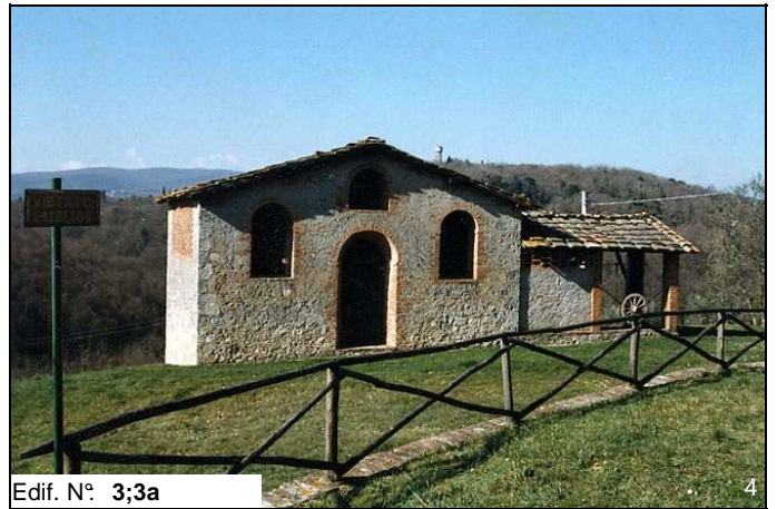
Edif. N° 3;3a