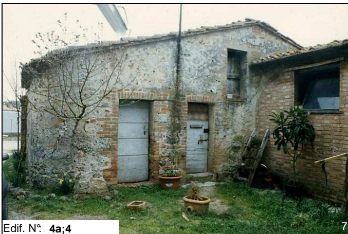
Edif. N° 4a;4