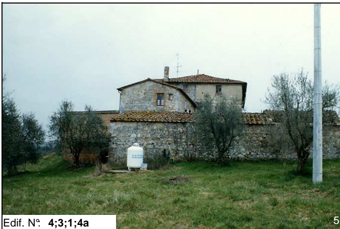
Edif. N° 4;3;1;4a