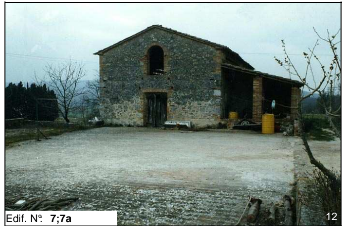
Edif. N° 7;7a