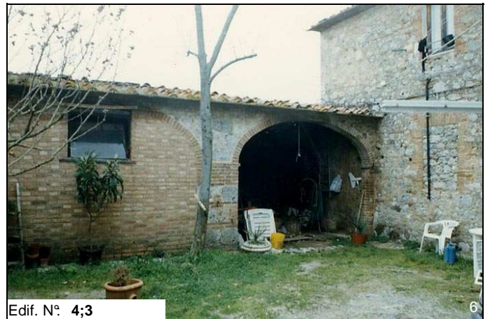
Edif. N° 4;3