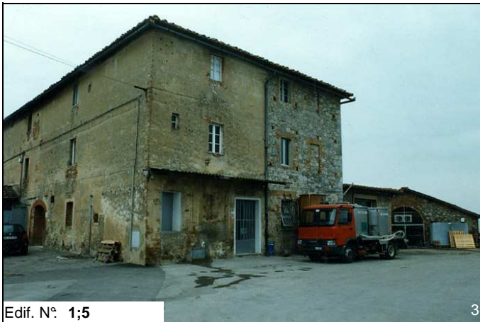
Edif. N° 1;5