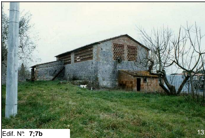
Edif. N° 7;7b