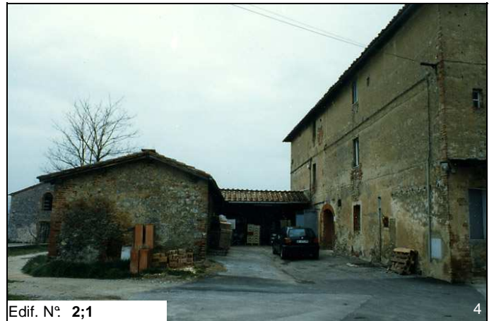
Edif. N° 2;1