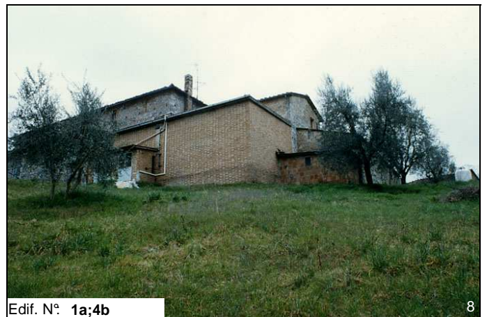
Edif. N° 1a;4b