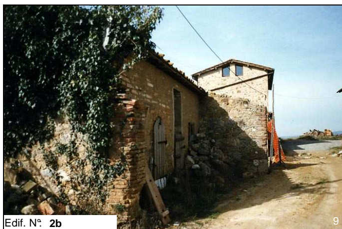
Edif. N° 2b