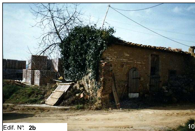
Edif. N° 2b