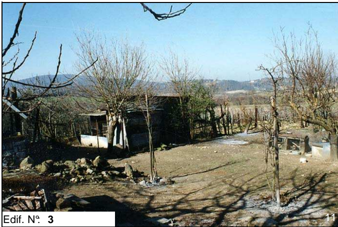
Edif. N° 3