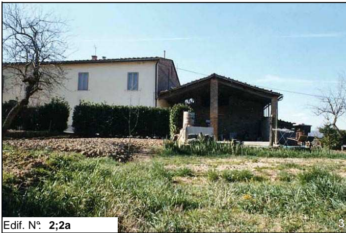
Edif. N° 2;2a