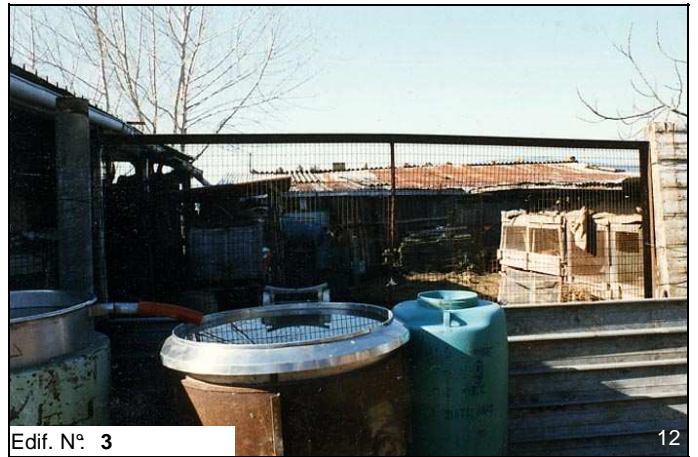
Edif. N° 3