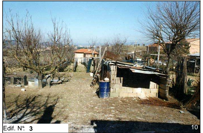
Edif. N° 3