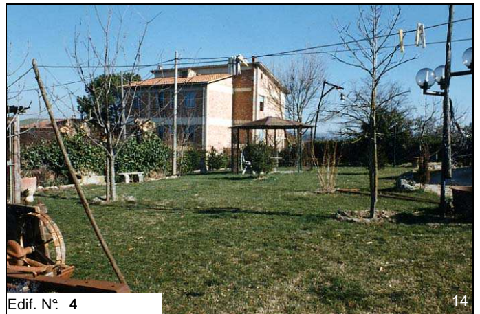
Edif. N° 4