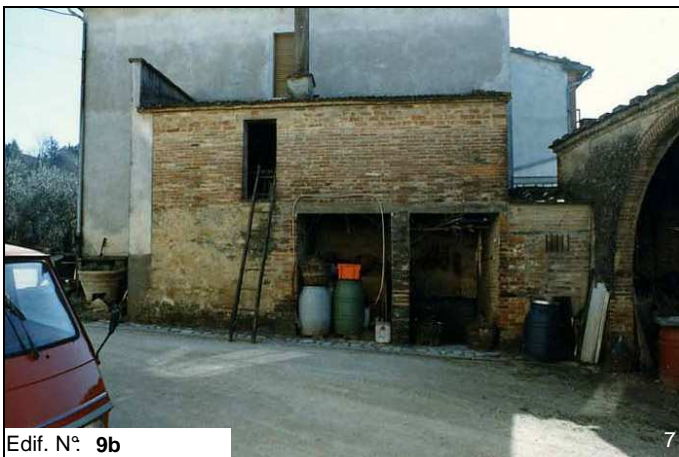
Edif. N° 9b