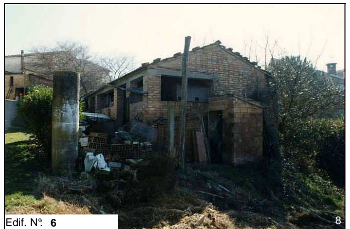
Edif. N° 6