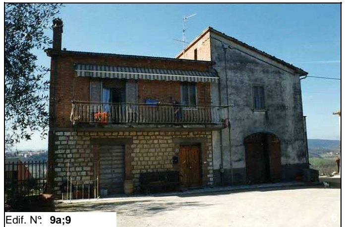
Edif. N° 9a;9