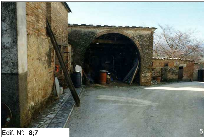
Edif. N° 8;7