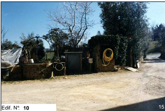
Edif. N° 10