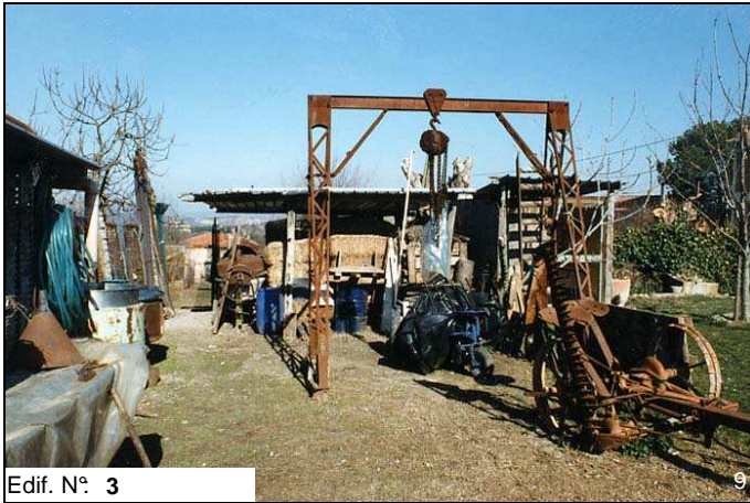
Edif. N° 3