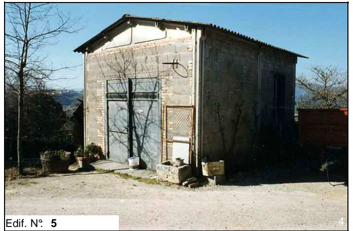
Edif. N° 5