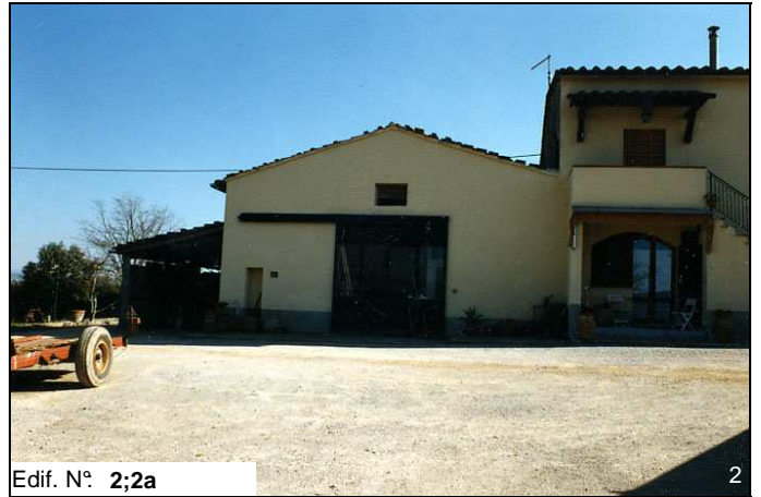
Edif. N° 2;2a