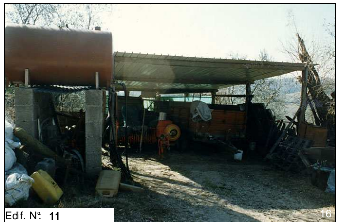
Edif. N° 11