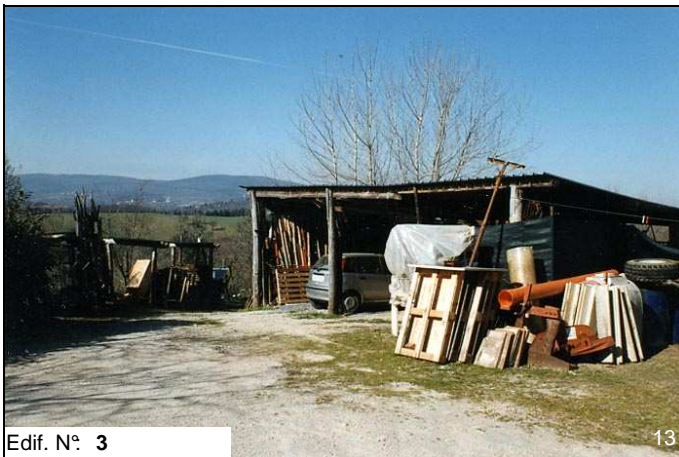
Edif. N° 3