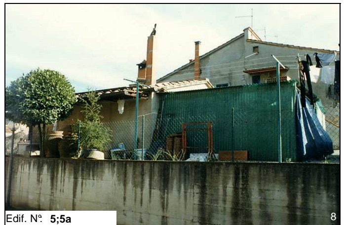
Edif. N° 5;5a