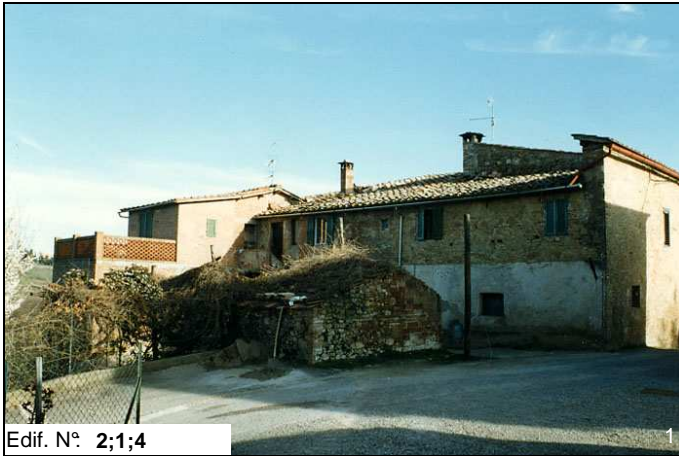
Edif. N° 2;1;4