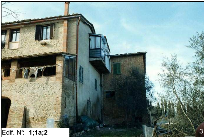
Edif. N° 1;1a;2