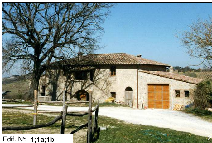
Edif. N° 1;1a;1b