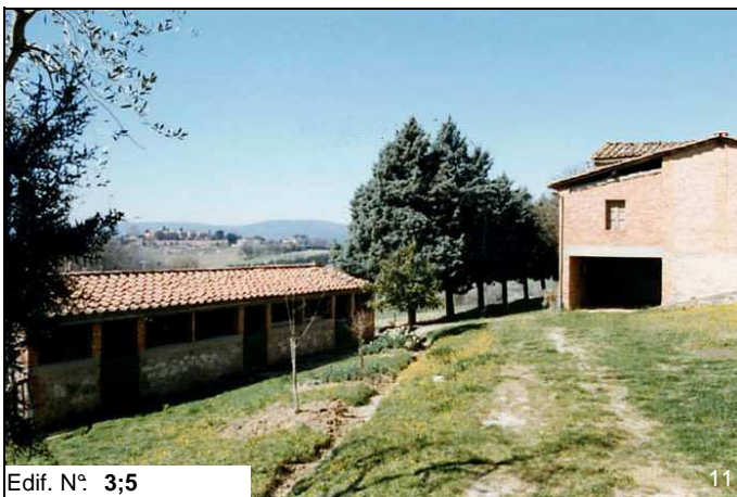
Edif. N° 3;5