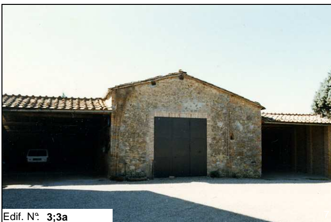
Edif. N° 3;3a