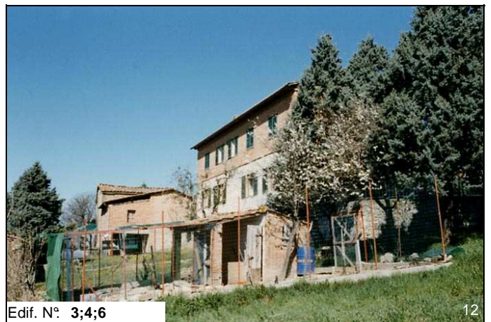
Edif. N° 3;4;6