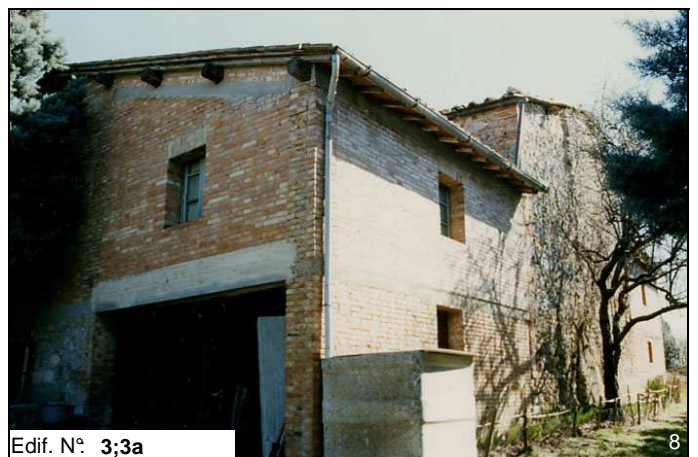
Edif. N° 3;3a