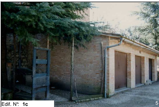
Edif. N° 1c