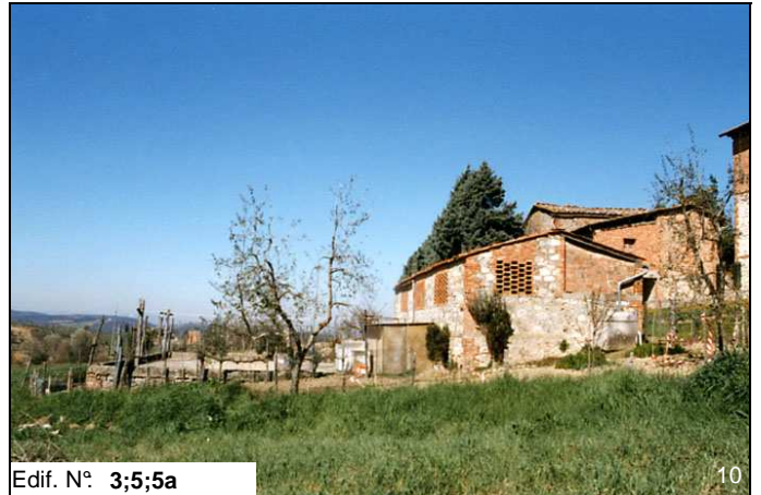
Edif. N° 3;5;5a