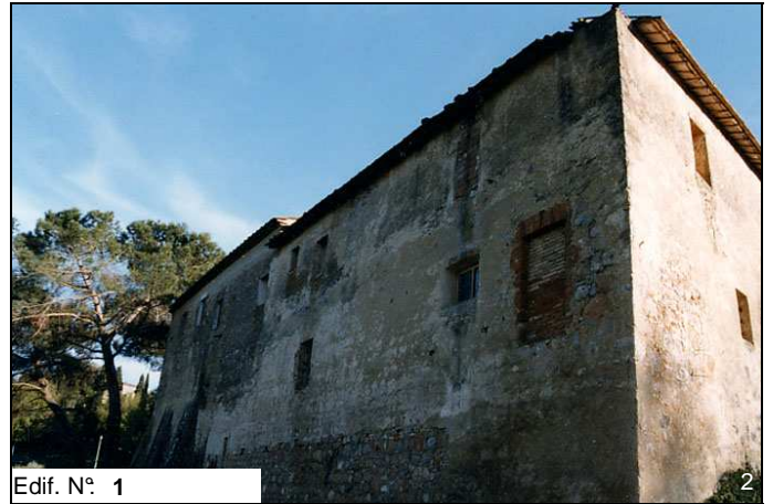
Edif. N° 1