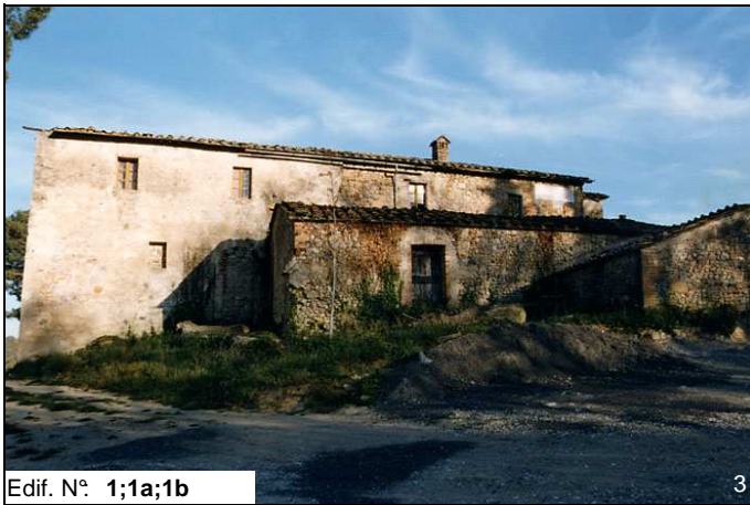
Edif. N° 1;1a;1b