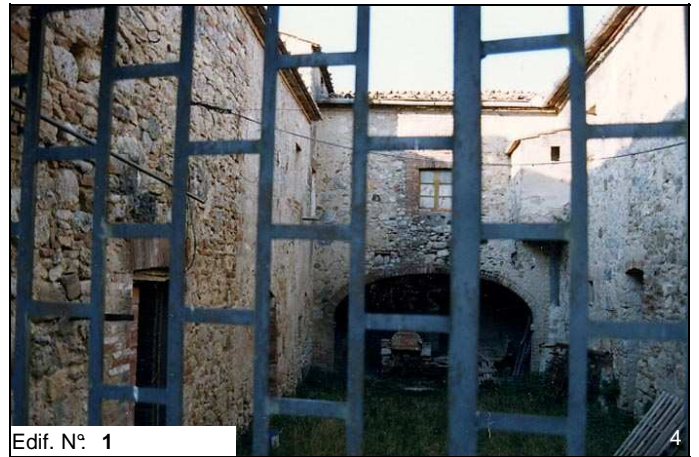
Edif. N° 1