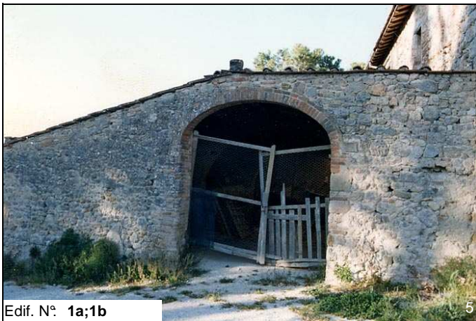
Edif. N° 1a;1b