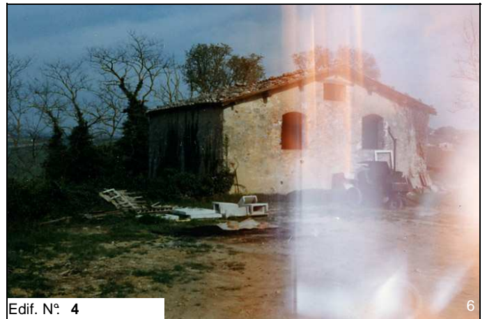
Edif. N° 4