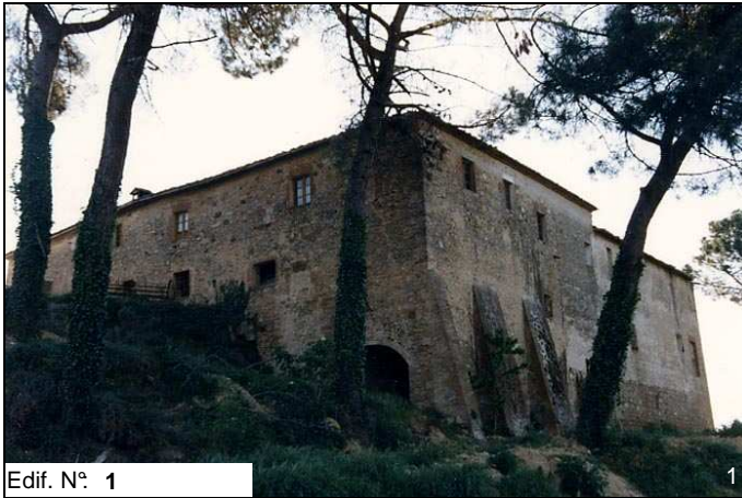
Edif. N° 1