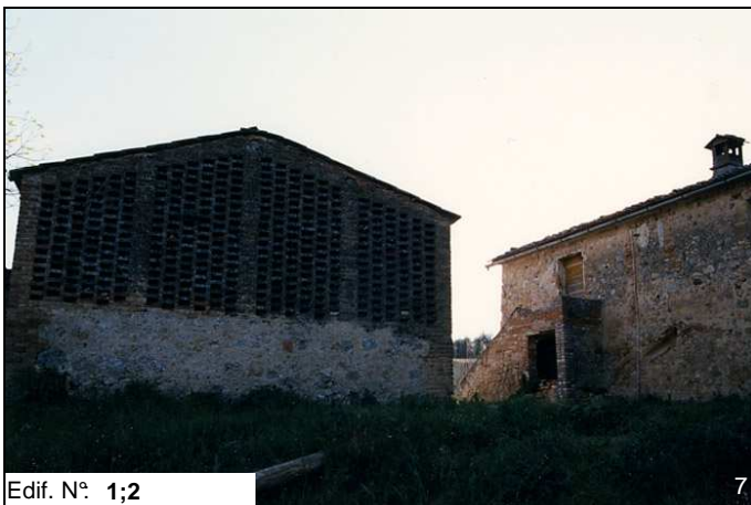
Edif. N° 1;2