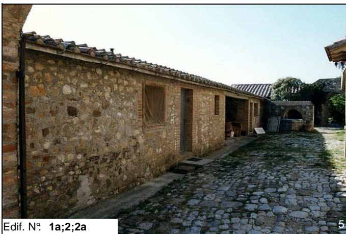
Edif. N° 1a;2;2a