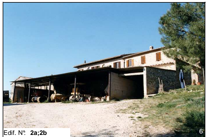
Edif. N° 2a;2b