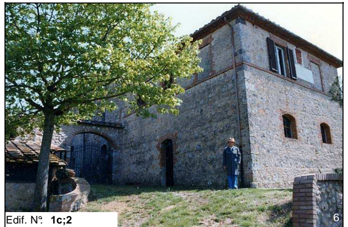
Edif. N° 1c;2