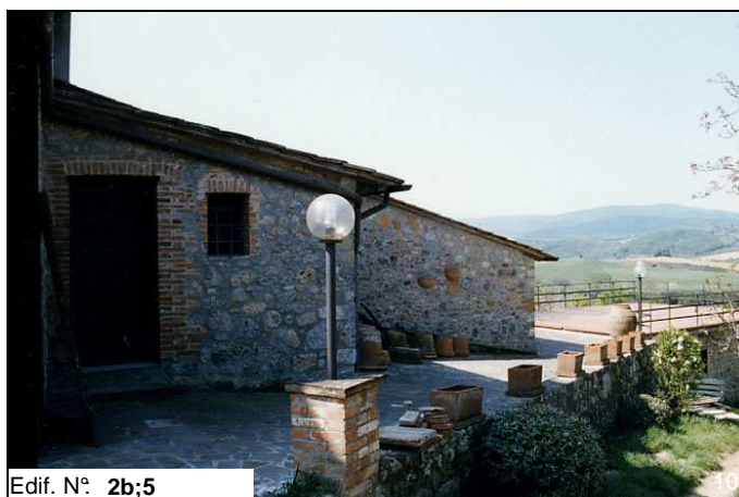
Edif. N° 2b;5