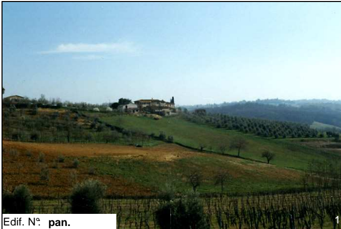
Edif. N° pan.