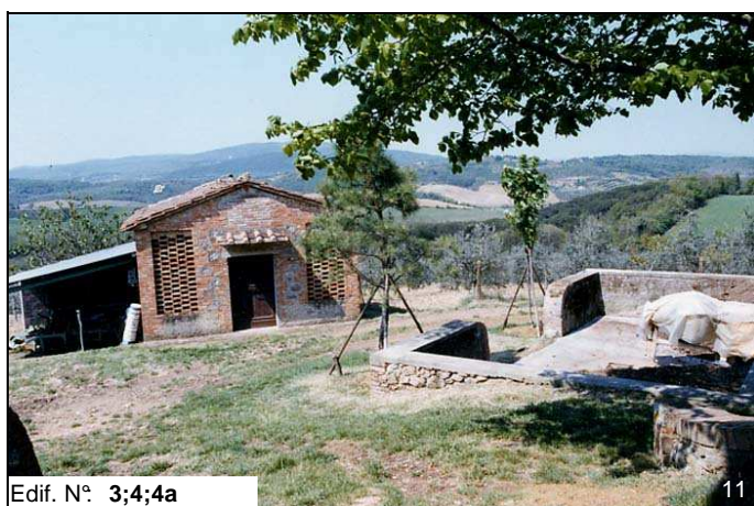
Edif. N° 3;4;4a