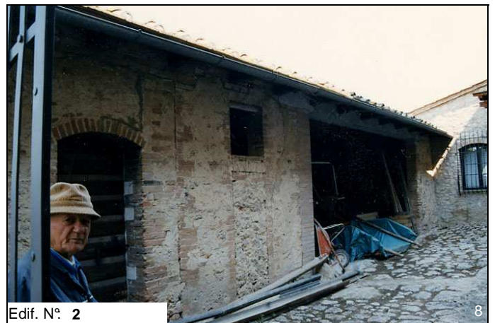
Edif. N° 2