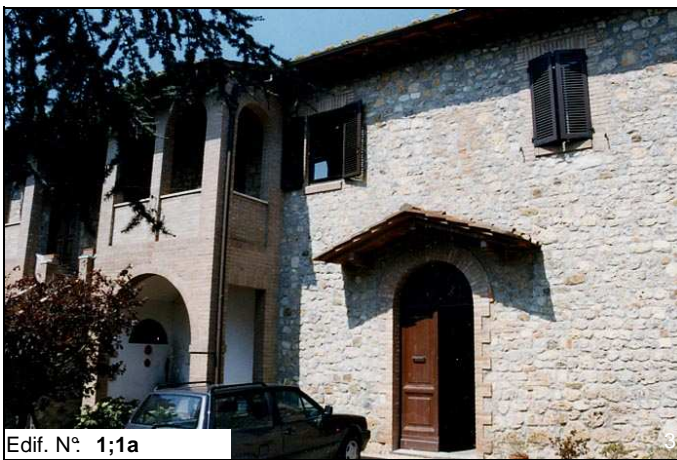
Edif. N° 1;1a