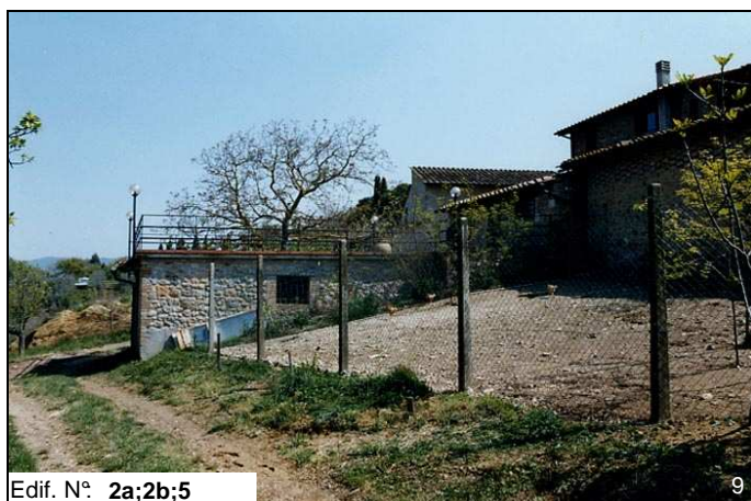
Edif. N° 2a;2b;5