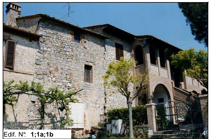
Edif. N° 1;1a;1b