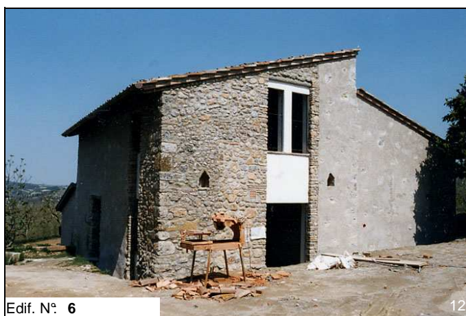
Edif. N° 6