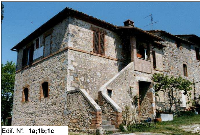
Edif. N° 1a;1b;1c