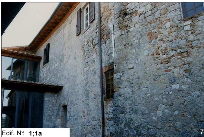
Edif. N° 1;1a