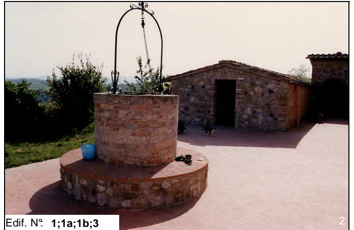
Edif. N° 1;1a;1b;3