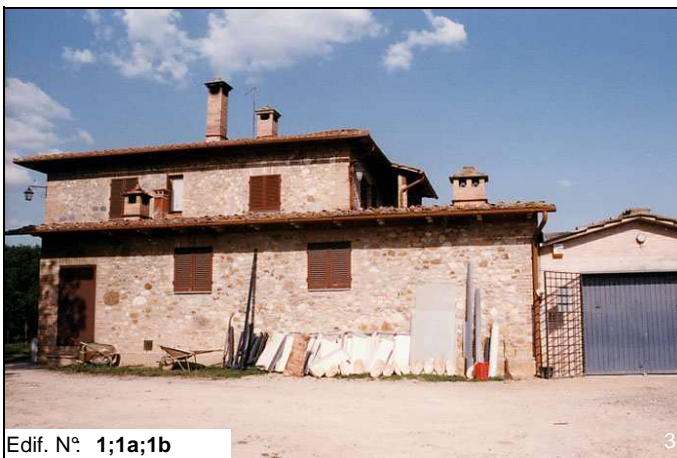
Edif. N° 1;1a;1b