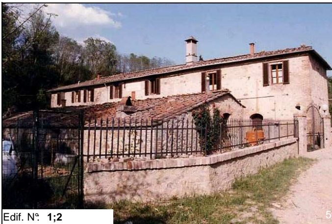
Edif. N° 1;2