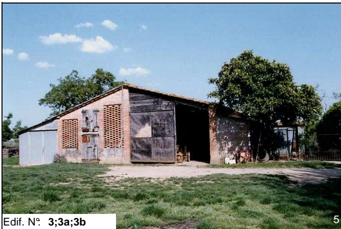
Edif. N° 3;3a;3b