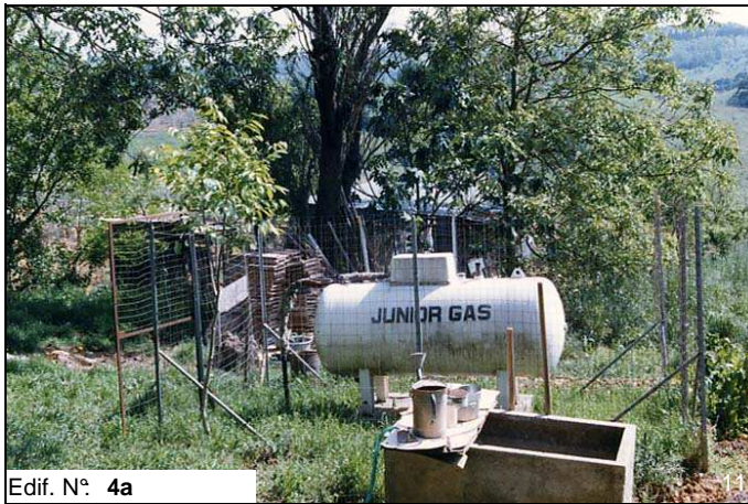
Edif. N° 4a