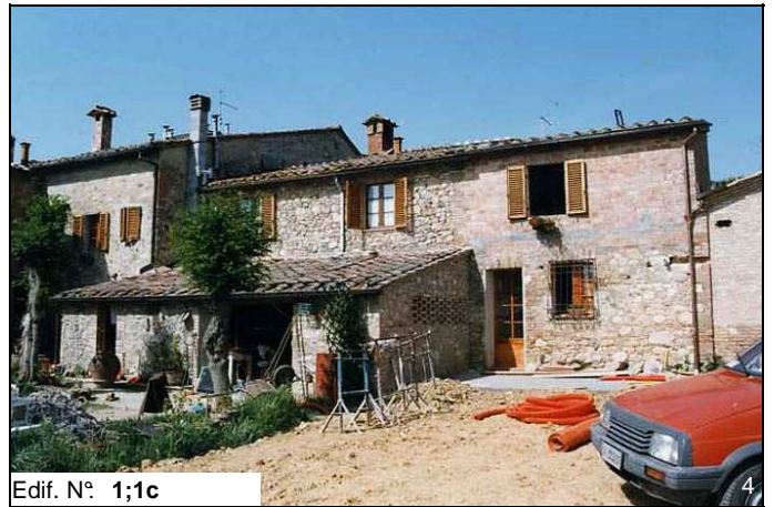
Edif. N° 1;1c