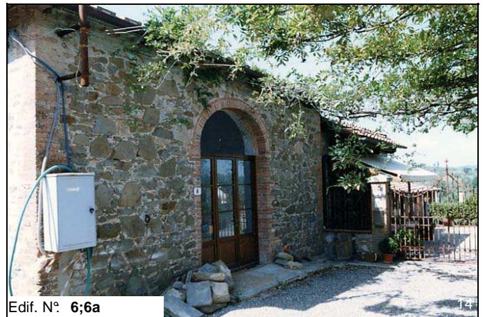
Edif. N° 6;6a