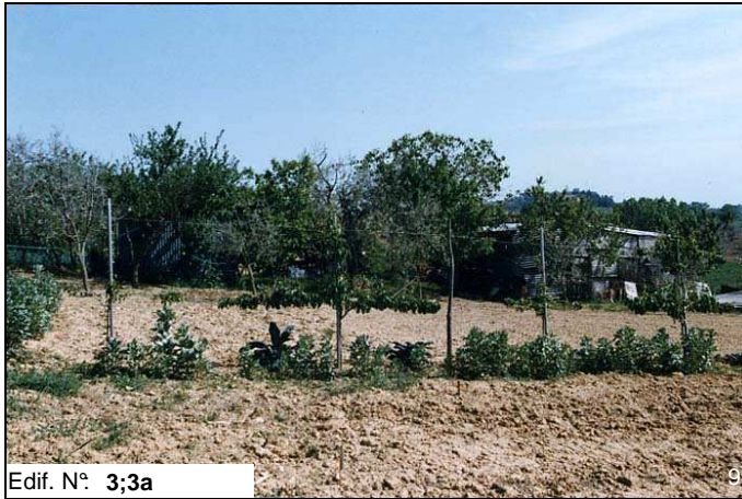
Edif. N° 3;3a