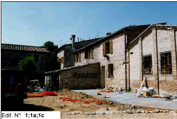
Edif. N° 1;1a;1c