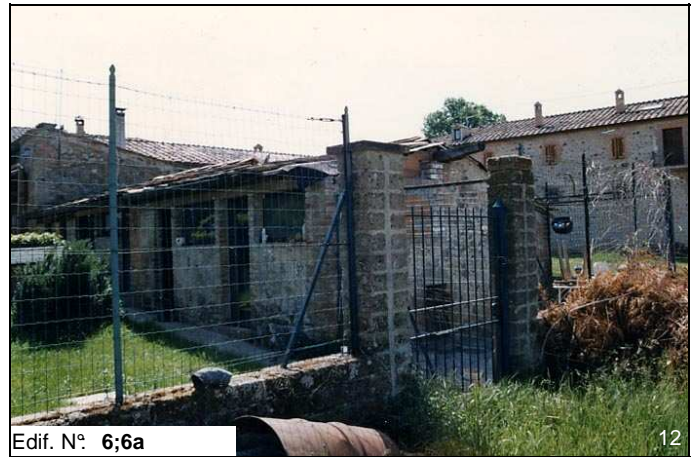
Edif. N° 6;6a