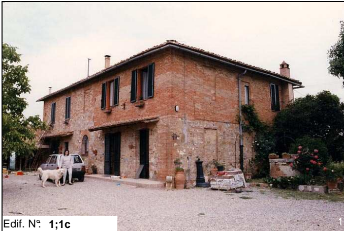
Edif. N° 1;1c