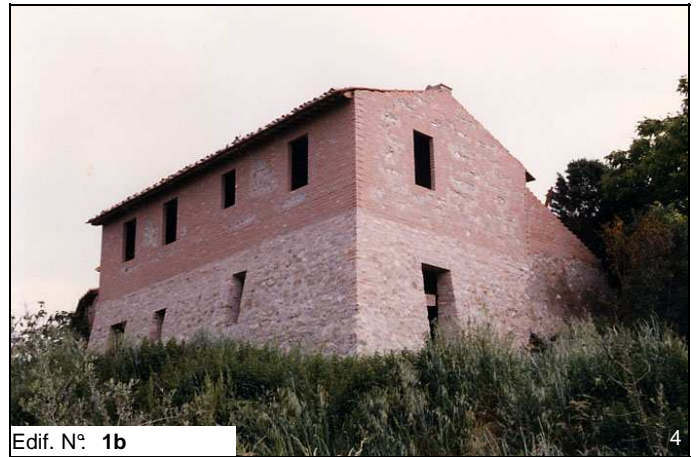
Edif. N° 1b