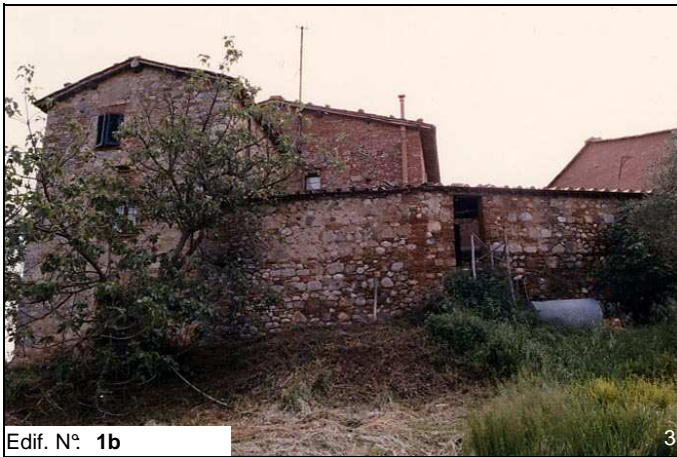
Edif. N° 1b