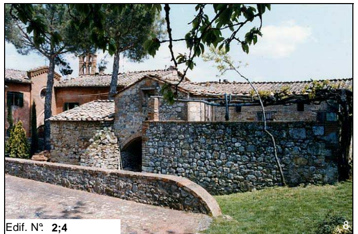
Edif. N° 2;4