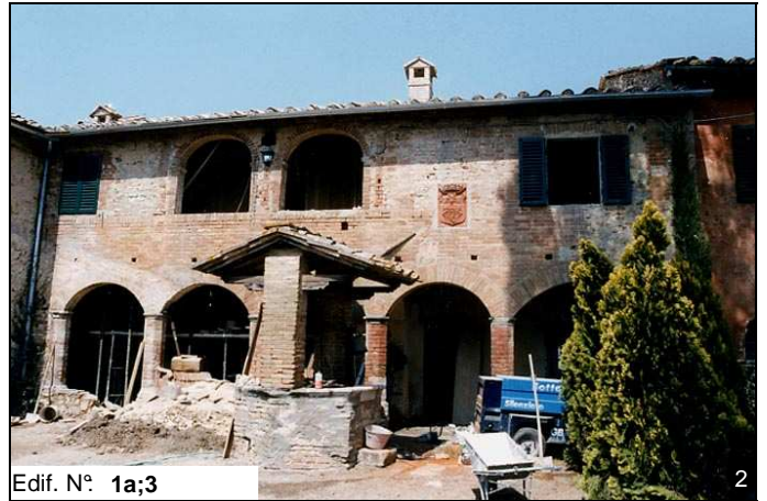
Edif. N° 1a;3