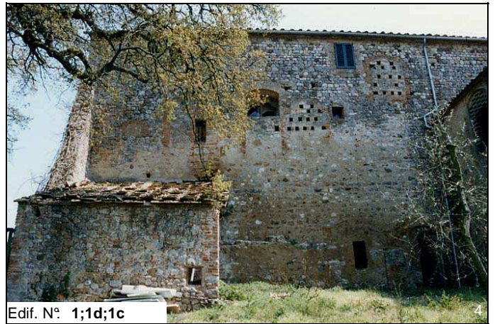
Edif. N° 1;1d;1c