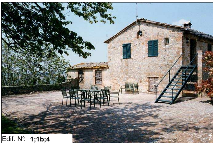
Edif. N° 1;1b;4