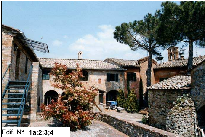
Edif. N° 1a;2;3;4