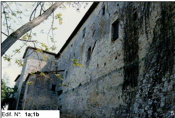
Edif. N° 1a;1b