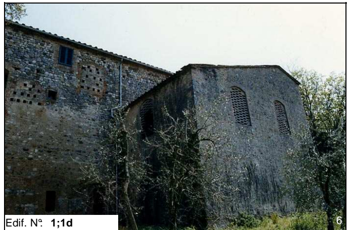
Edif. N° 1;1d