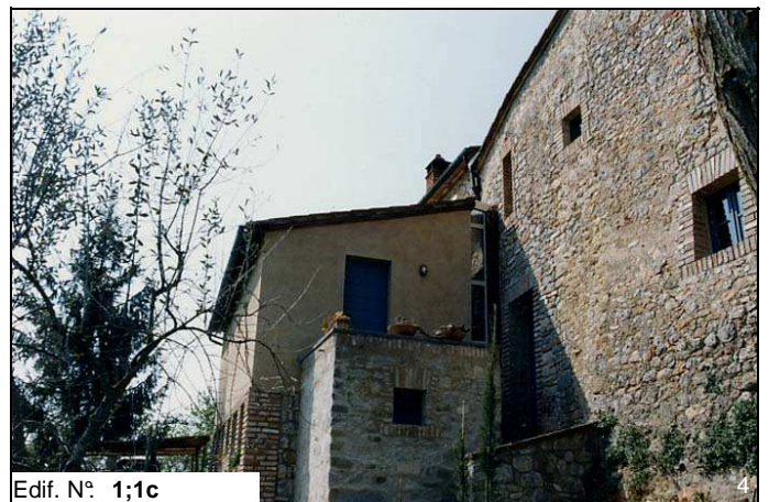
Edif. N° 1;1c