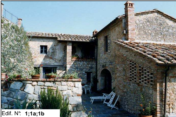
Edif. N° 1;1a;1b