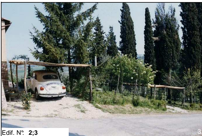
Edif. N° 2;3