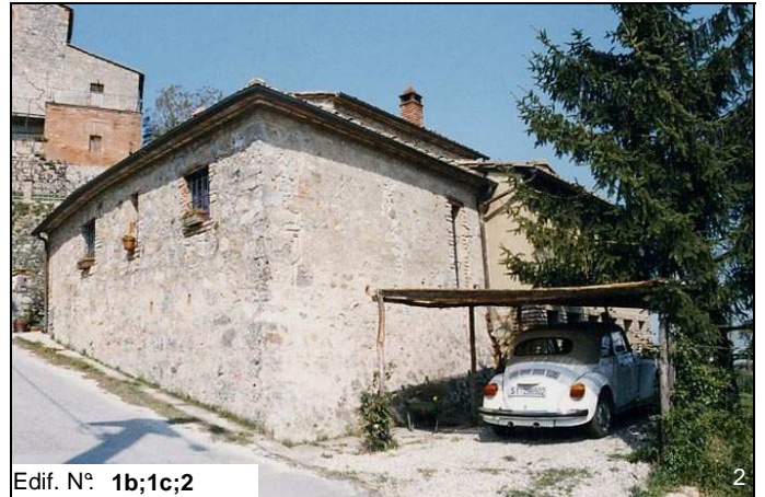
Edif. N° 1b;1c;2